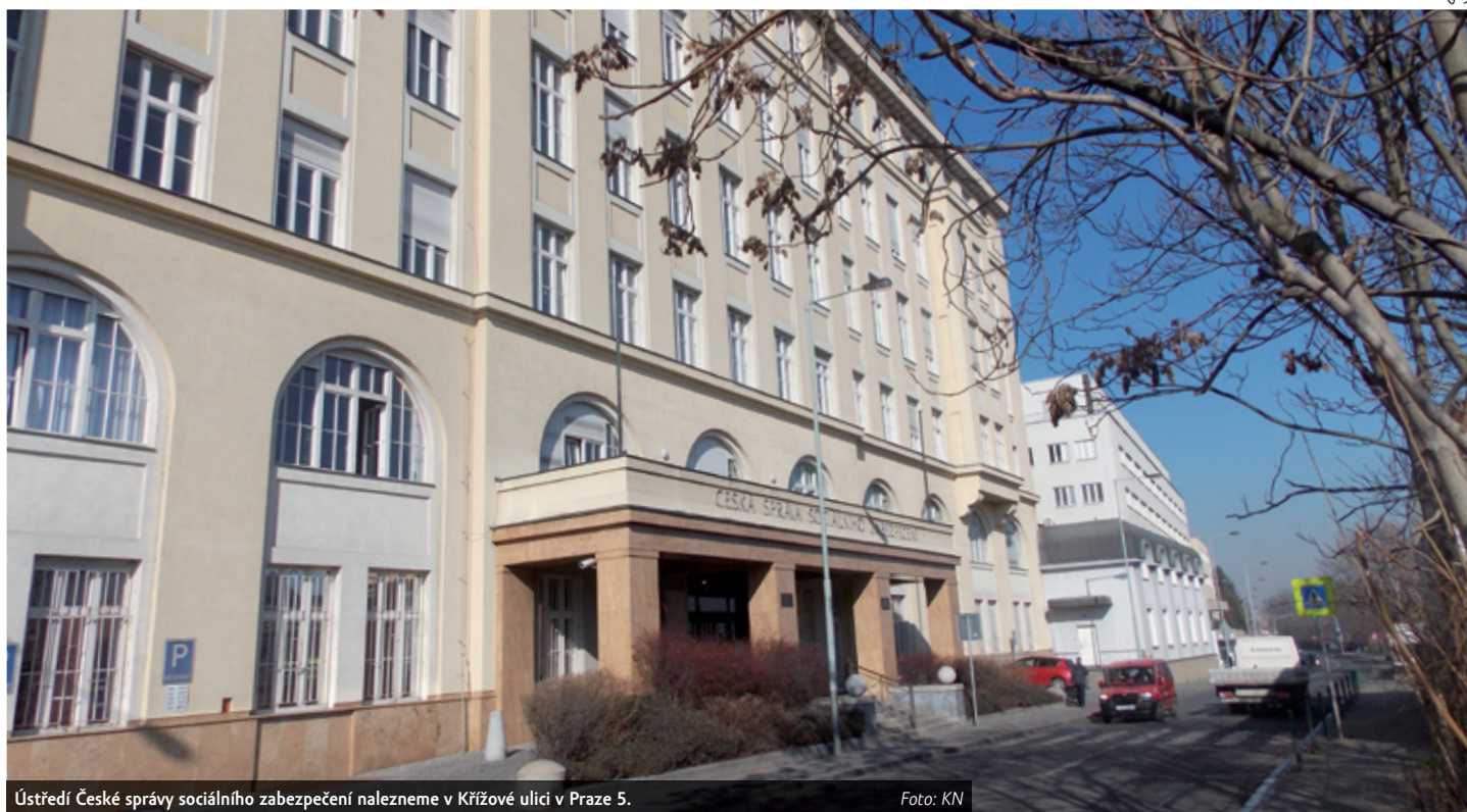
Ústředí České správy sociálního zabezpečení nalezneme v Křižové ulici v Praze 5.