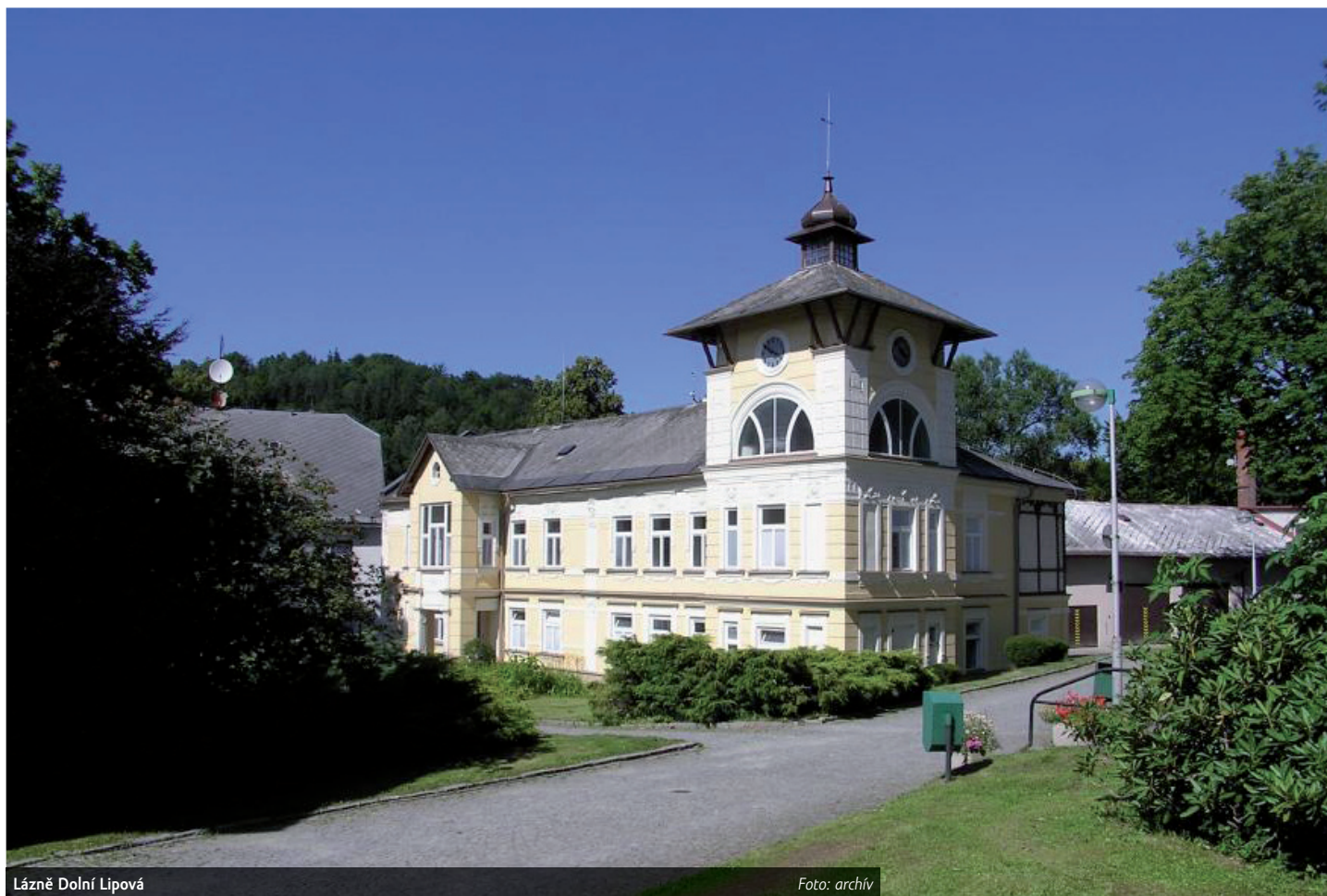
Lázně Dolní Lipová