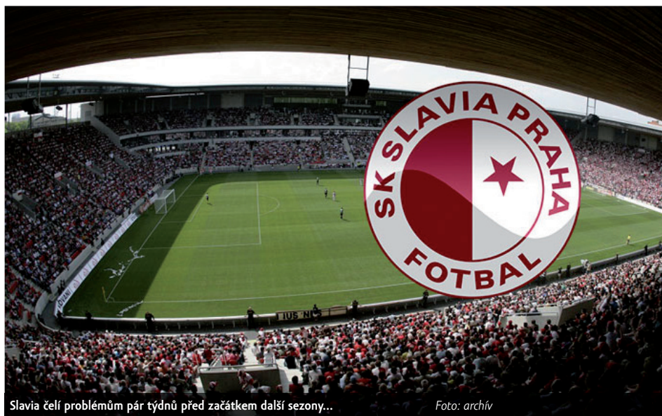
Slavia čelí problémům pár týdnů před začátkem další sezony...