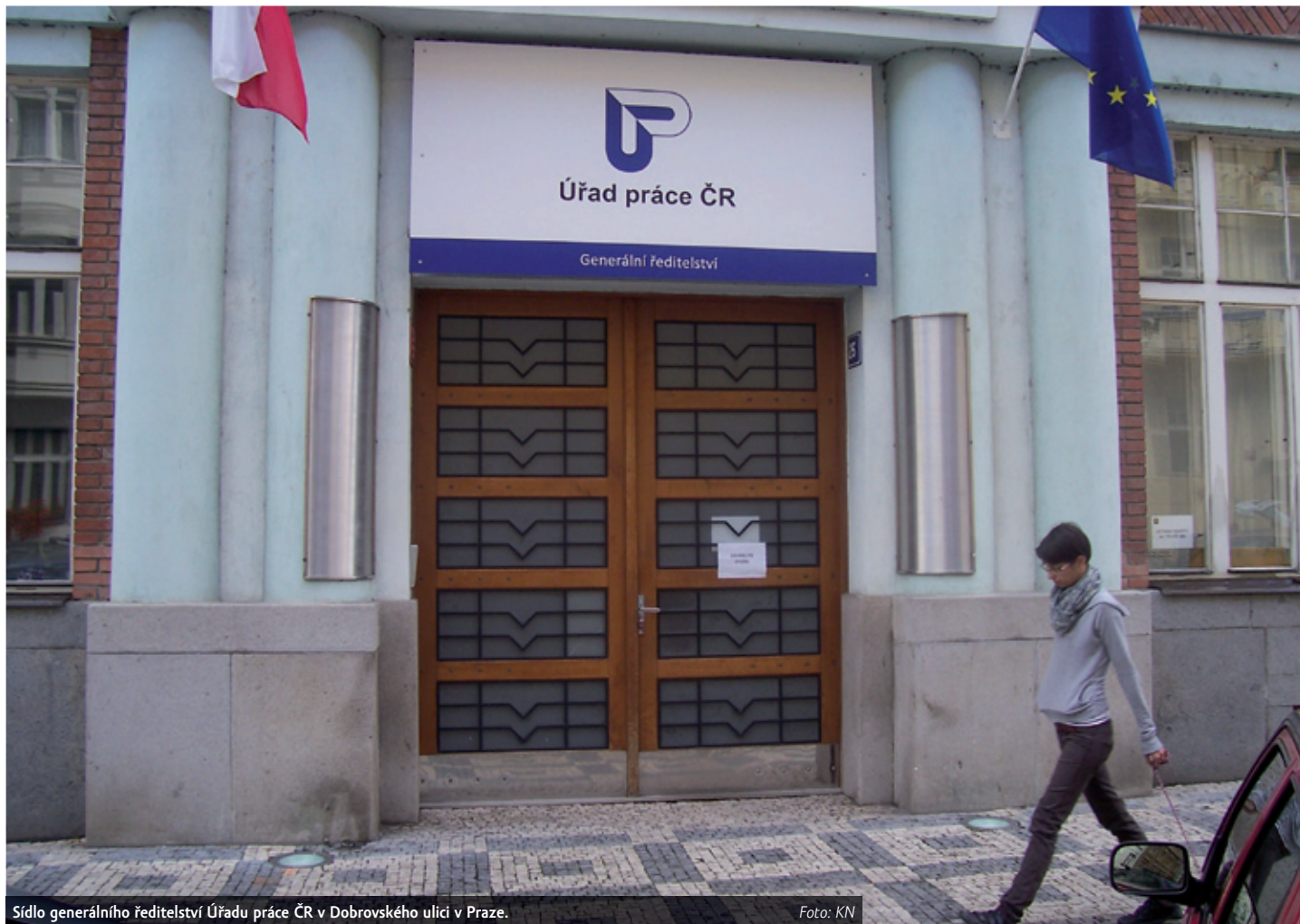
Sídlo generálního ředitelství Úřadu práce ČR v Dobrovského ulici v Praze.

„Jde o téměř dvojnásobný nárůst oproti stejnému období loňského roku a nejvyšší počet volných pracovních