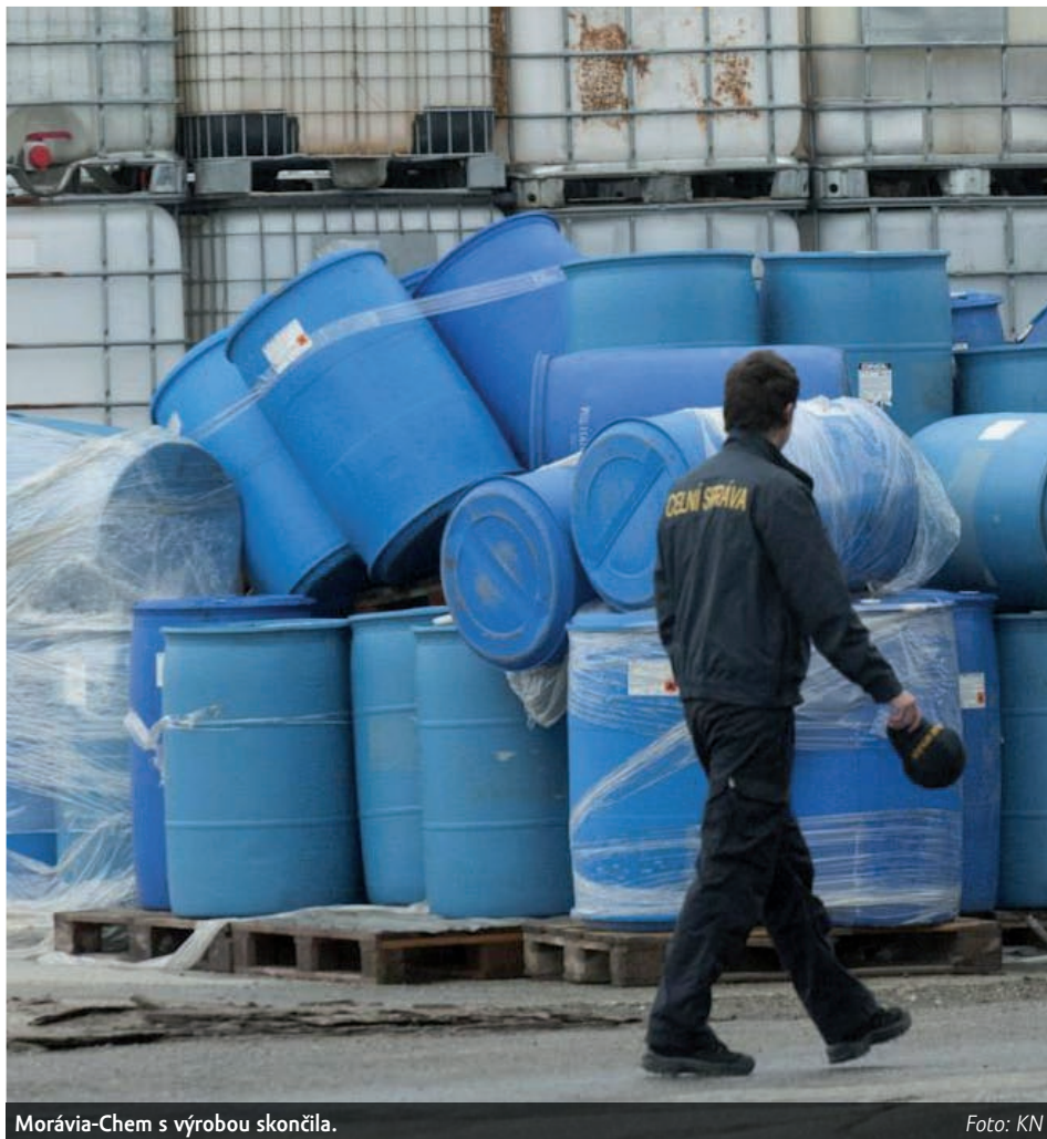
Morávia-Chem s výrobou skončila.