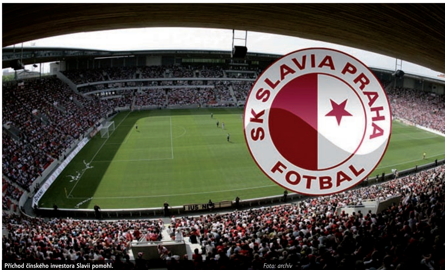
Příchod čínského investora Slavii pomohl.