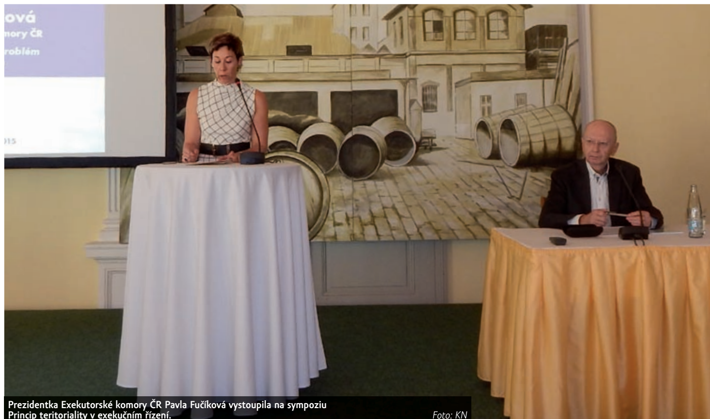
Prezidentka Exekutorské komory ČR Pavla Fučíková vystoupila na sympoziu Princip teritoriality v exekučním řízení.

Projednávání toho, zda omezit akční rádius exekutorů jen v rámci okresů či krajů podle jejich sídla a místa bydliště dlužníka – teritorialita – čeká nyní naše záko-