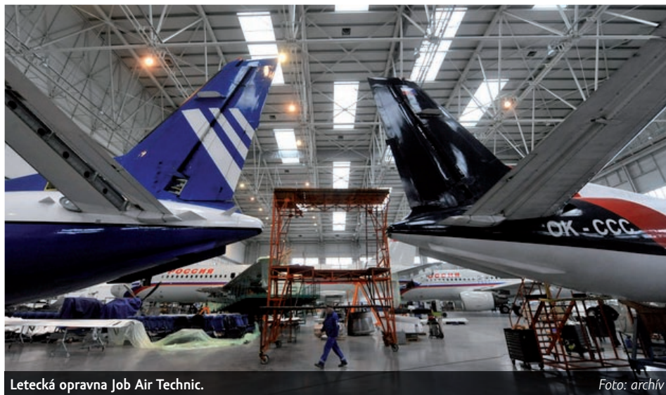
Letecká opravná Job Air Technic.