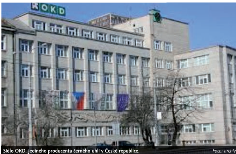
Sídlo OKD, jediného producenta černého uhlí v České republice.