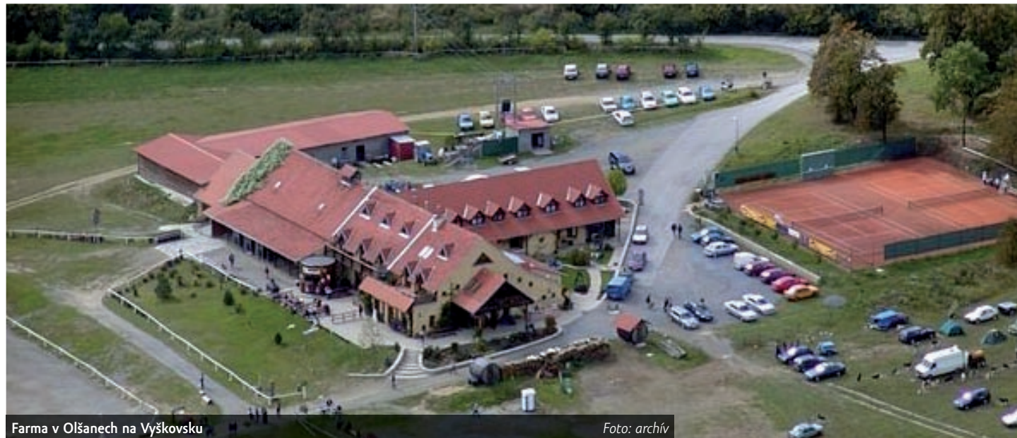
Farma v Olšanech na Vyškovsku