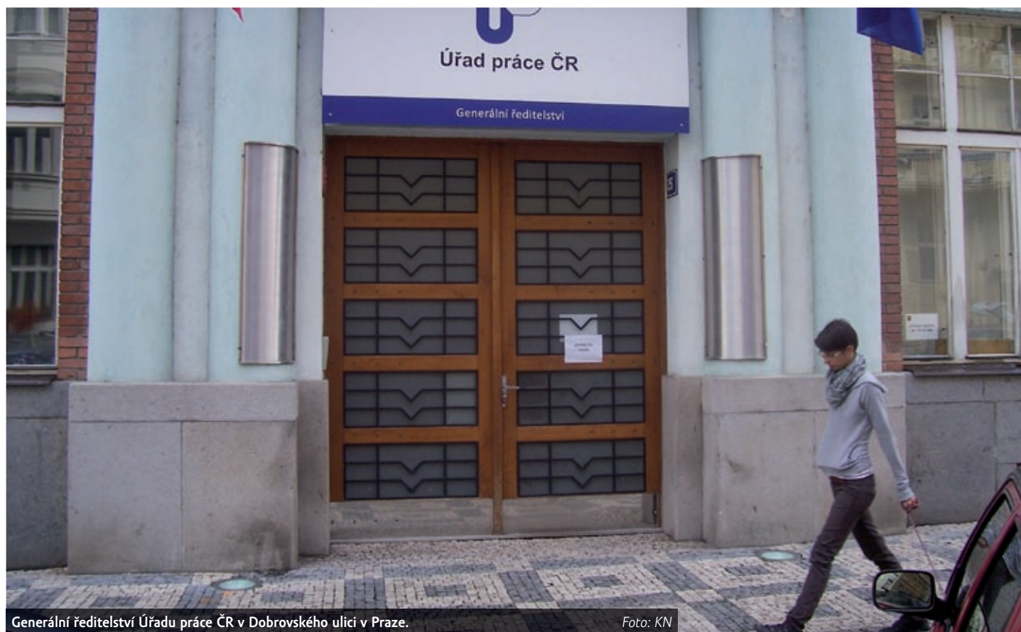
Generální ředitelství Úřadu práce ČR v Dobrovského ulici v Praze.