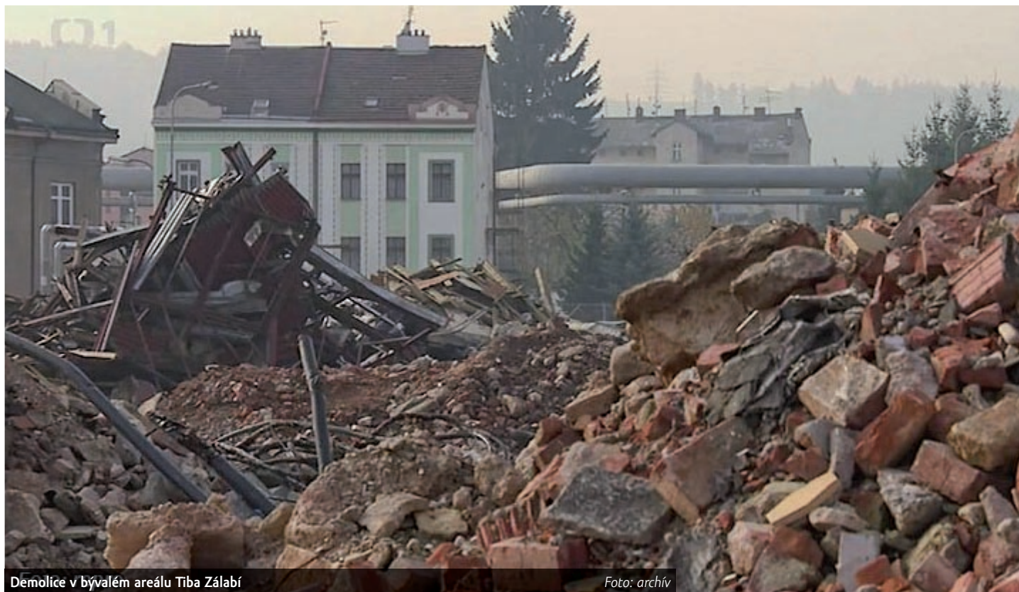
Demolice v bývalém areálu Tiby Zálabí

Do roku 1930 tu existovalo asi 17 textilních firem. Po druhé světové válce, 1. ledna 1946, vznikla textilka Tiba sloučením několika znárodněných závodů na výrobu potištěných tkanin.