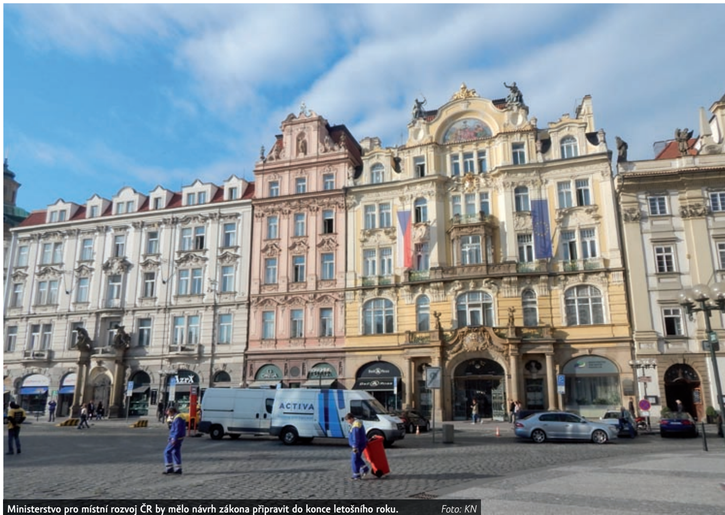
Ministerstvo pro místní rozvoj ČR by mělo návrh zákona připravit do konce letošního roku.

Věcný záměr zákona o realitním zprostředkování má zejména vymezit základní právní rámec realitního zprostředkování. Mimo jiné bude definovat realitní zpro-