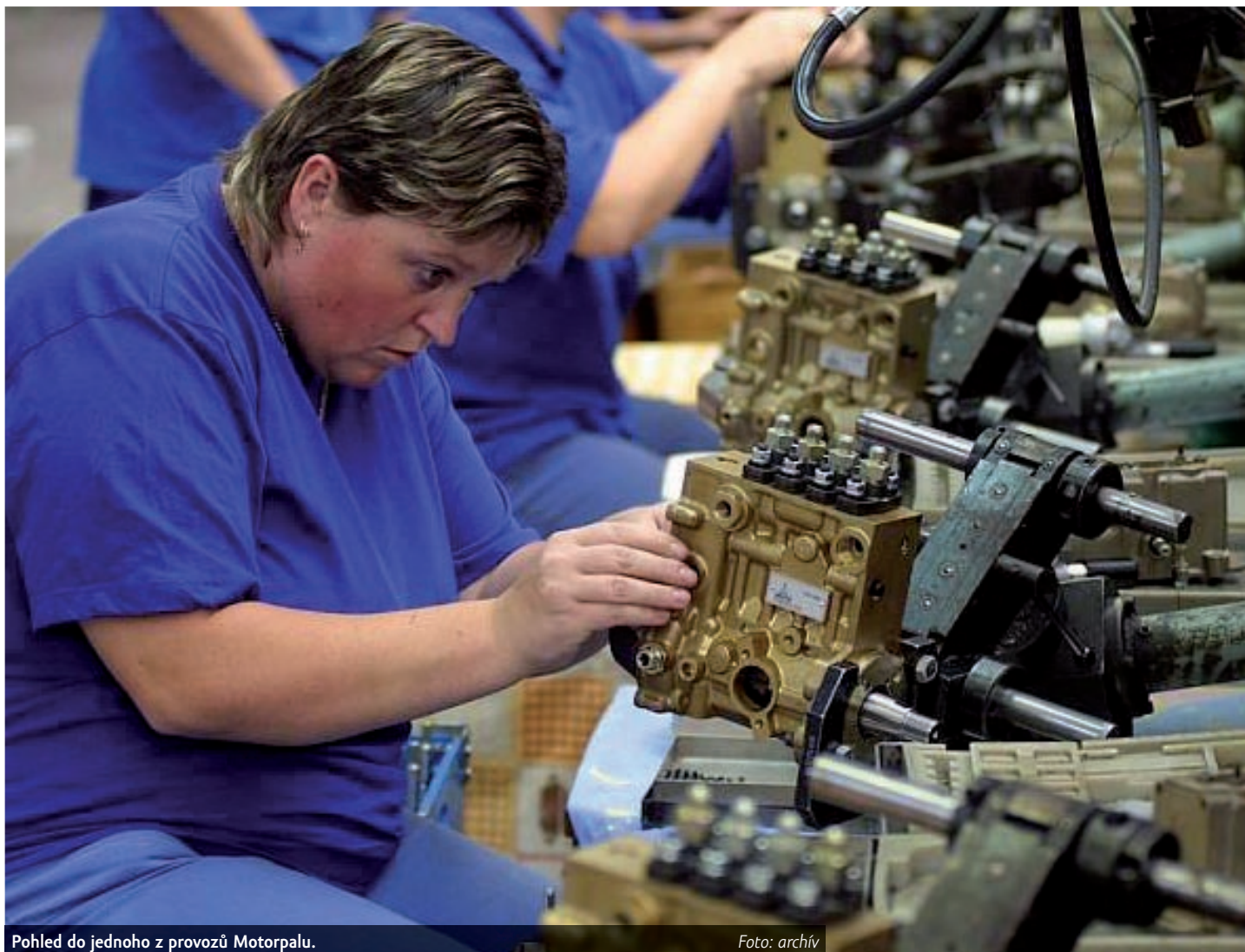
Pohled do jednoho z provozů Motorpalu.