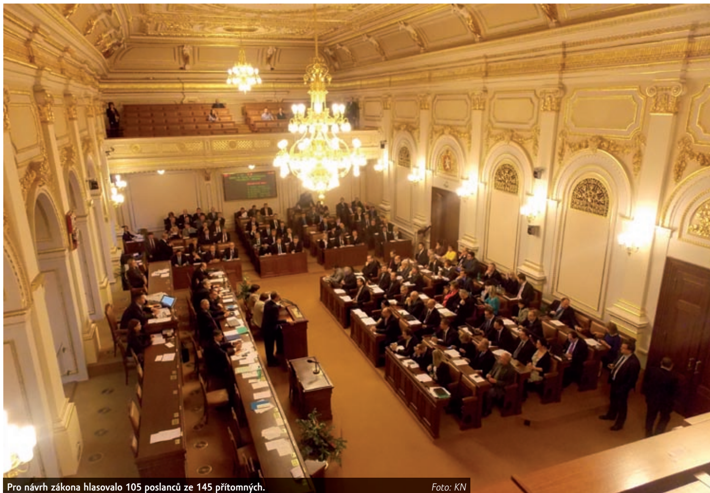
Pro návrh zákona hlasovalo 105 poslanců ze 145 přítomných.

„Ačkoliv primárním cílem elektronické evidence tržeb je narovnání podnikatelského prostředí v české ekonomice, nese s sebou i nezanedbatelný fiskální efekt. Očekávaný dodatečný daňový výnos na daních z příjmů a daní z přidané hodnoty v sektorech stravování, ubytování a obchodu, tedy za první dvě fáze evidence, je až 12,5 mld. Kč ročně. Za ostatní sektory je potenciál dodatečných výnosů pět až šest miliard korun ročně. Celkový daňový výnos po plném náběhu evidence tržeb bude 18 mld. Kč ročně,” uvedl ministr financí Andrej Babiš. „Z těchto 18 mld. Kč půjde přibližně čtyři miliardy korun ročně do rozpočtů obcí a přibližně 1,5 mld. Kč do rozpočtů krajů. To znamená více investic do lokálních