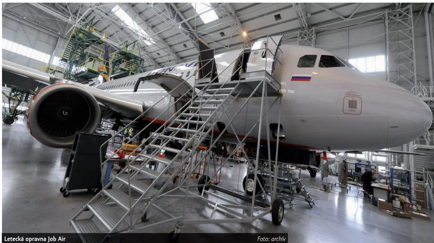
Letecká oprava Job Air