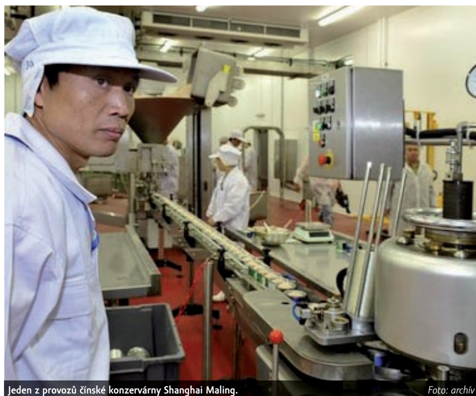
Jeden z provozů čínské konzervárny Shanghai Maling.