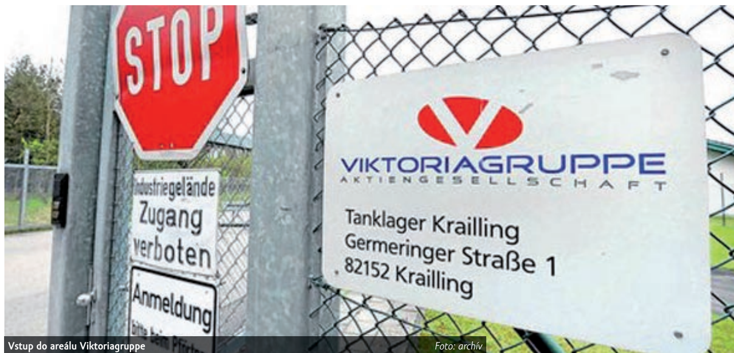
Vstup do areálu Viktoriagruppe

Mimo záznam pak zástupci českého státu tvrdí, že Mollen už zřejmě má dohodu s některým ze zájemců