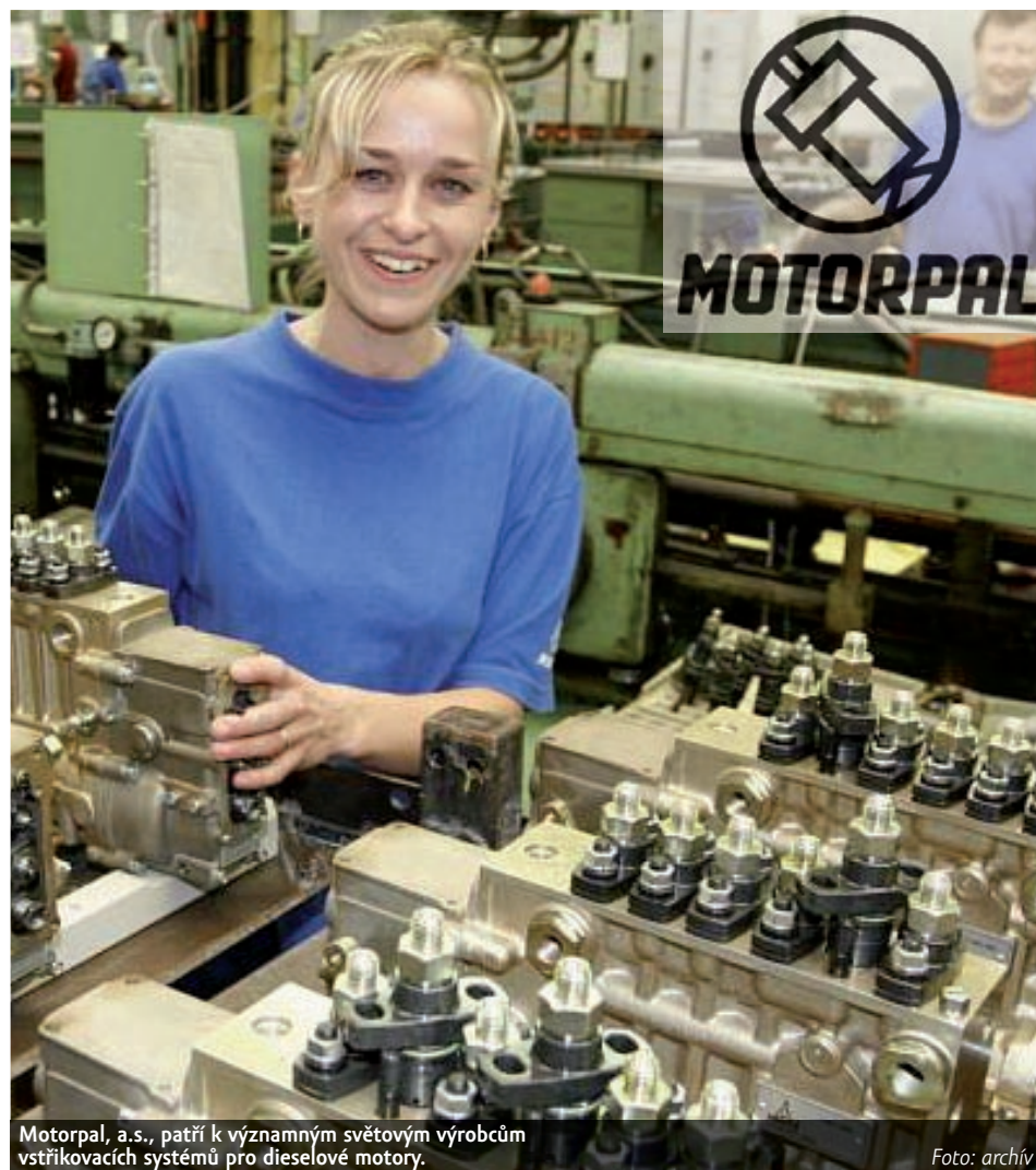
Motorpal, a.s., patří k významným světovým výrobcům vstříkacích systémů pro dieselové motory.