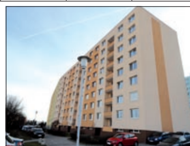
Místo konání e-aukce: www.prokonzulta.cz, dne 19.4.2016.