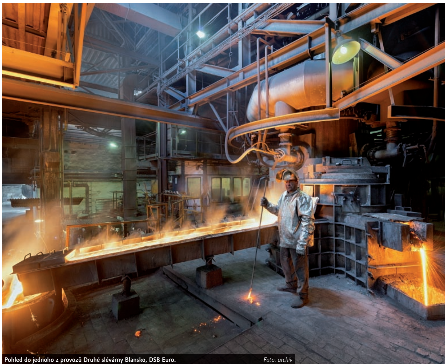
Pohled do jednoho z provozů Druhé slévárny Blansko, DSB Euro.