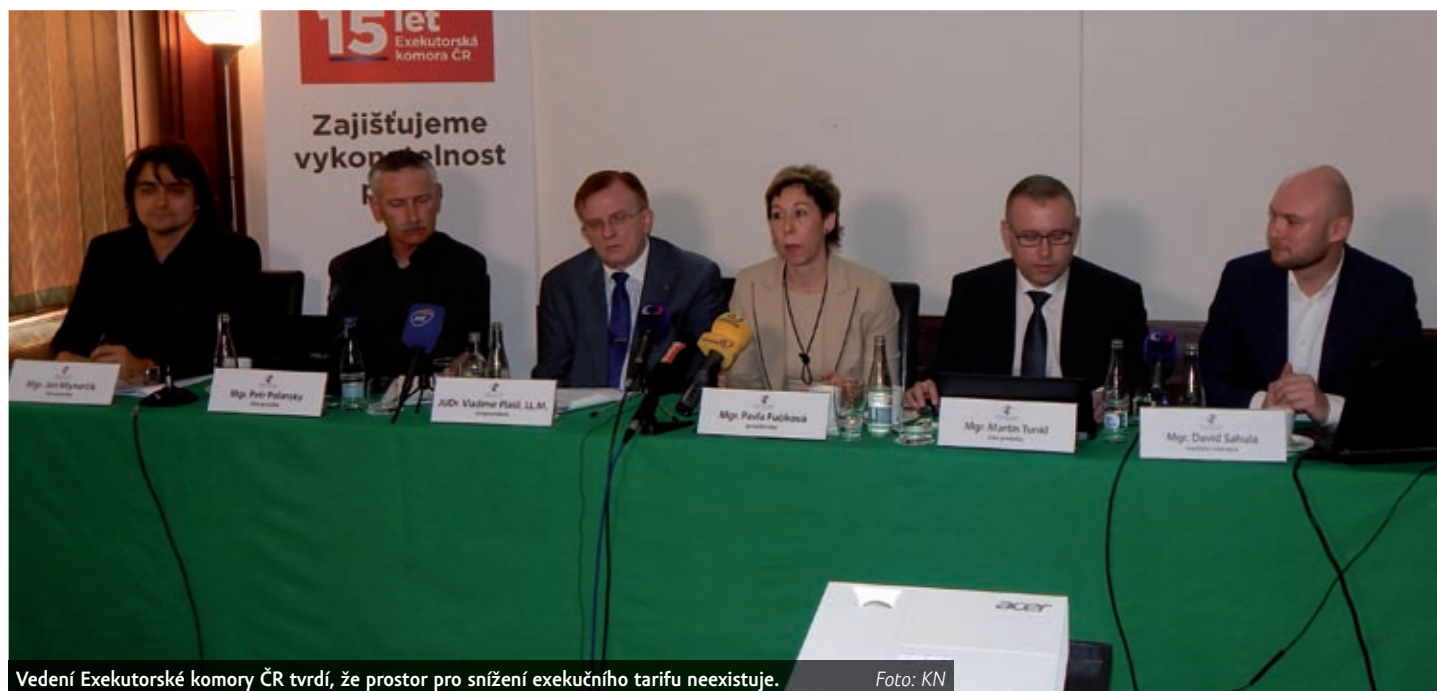
Vedení Exekutorské komory ČR tvrdí, že prostor pro snížení exekučního tarifu neexistuje.

Exekutorská komora podporuje zavedení povinných záloh věřitelům, protože je to cesta k zodpovědnému vymáhání, ale to neotevřítá možnost ke snížení tarifu. Předně, zavedení poplatků a záloh by řešilo nově nařízené exekuce, ale nezajistilo by úhradu nákladů asi tři