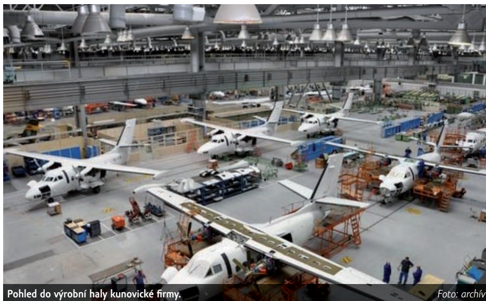
Pohled do výrobní haly kunovické firmy.

A svůj záměr nepřipojit se k insolvenčnímu návrhu oznámila také společnost Fornax ze Strážnice, již Aircraft Industries údajně dluží 1,37 milionu korun. „Současná situace ve společnosti Aircraft Industries je nám známa, ale zatím nevidíme důvod, proč bychom se měli připojovat k nějakému insolvenčnímu řízení,“ zní pro-