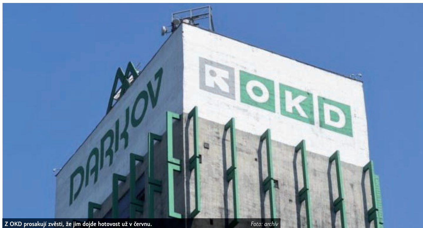
Z OKD prosakují zvěsti, že jim dojde hotovost už v červnu.

Při reorganizaci si vliv na chod firmy i rozprodávání jejího majetku zachovávají akcionáři a management.