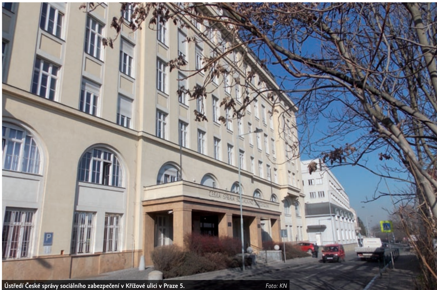
Ústředí České správy sociálního zabezpečení v Křižové ulici v Praze 5.

Důchodci však do naprosté chudoby často nespadnou jen díky tomu, že kvůli exekuci nemohou přijít o celou výplatu důchodu. Musí jim totiž vždy zůstat takzvaná