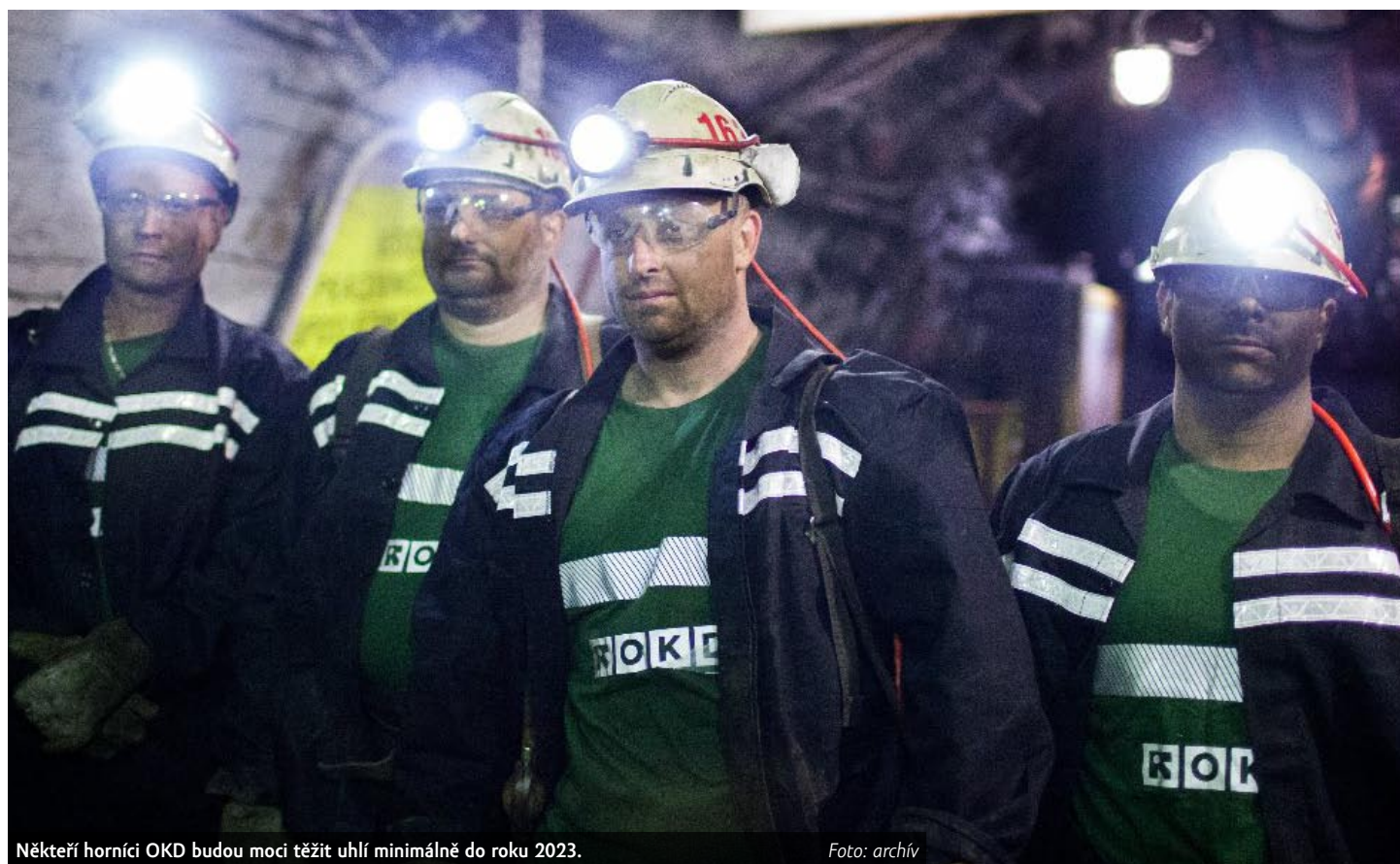
Někteří horníci OKD budou moci těžit uhlí minimálně do roku 2023.