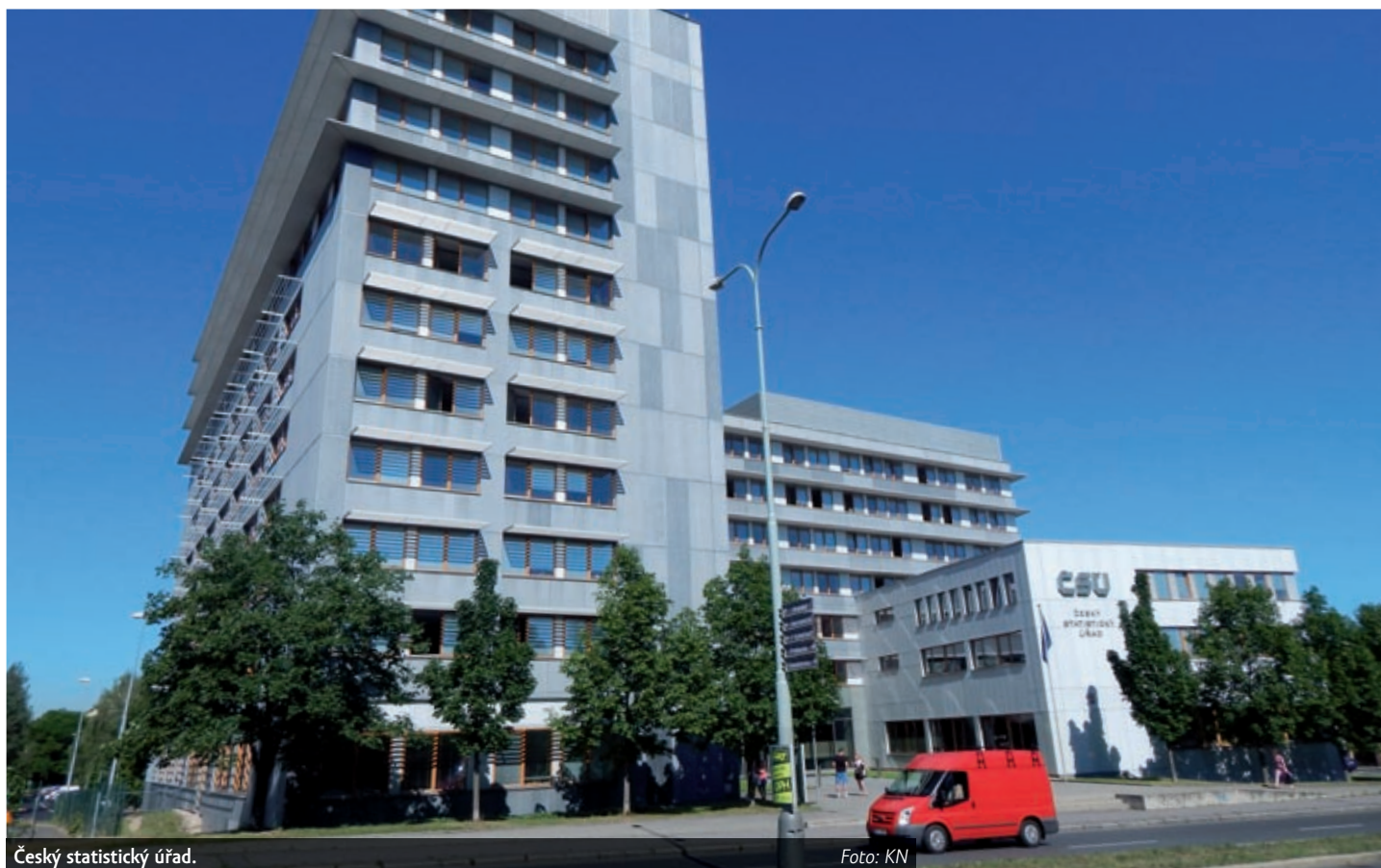
Český statistický úřad.

Největším „skokanem“ je internetový obchod. Ten