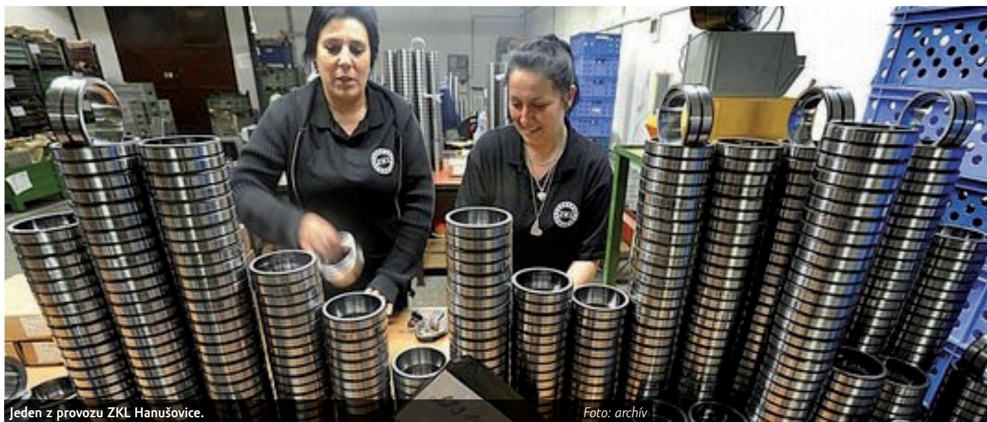
Jeden z provozů ZKL Hanušovice.