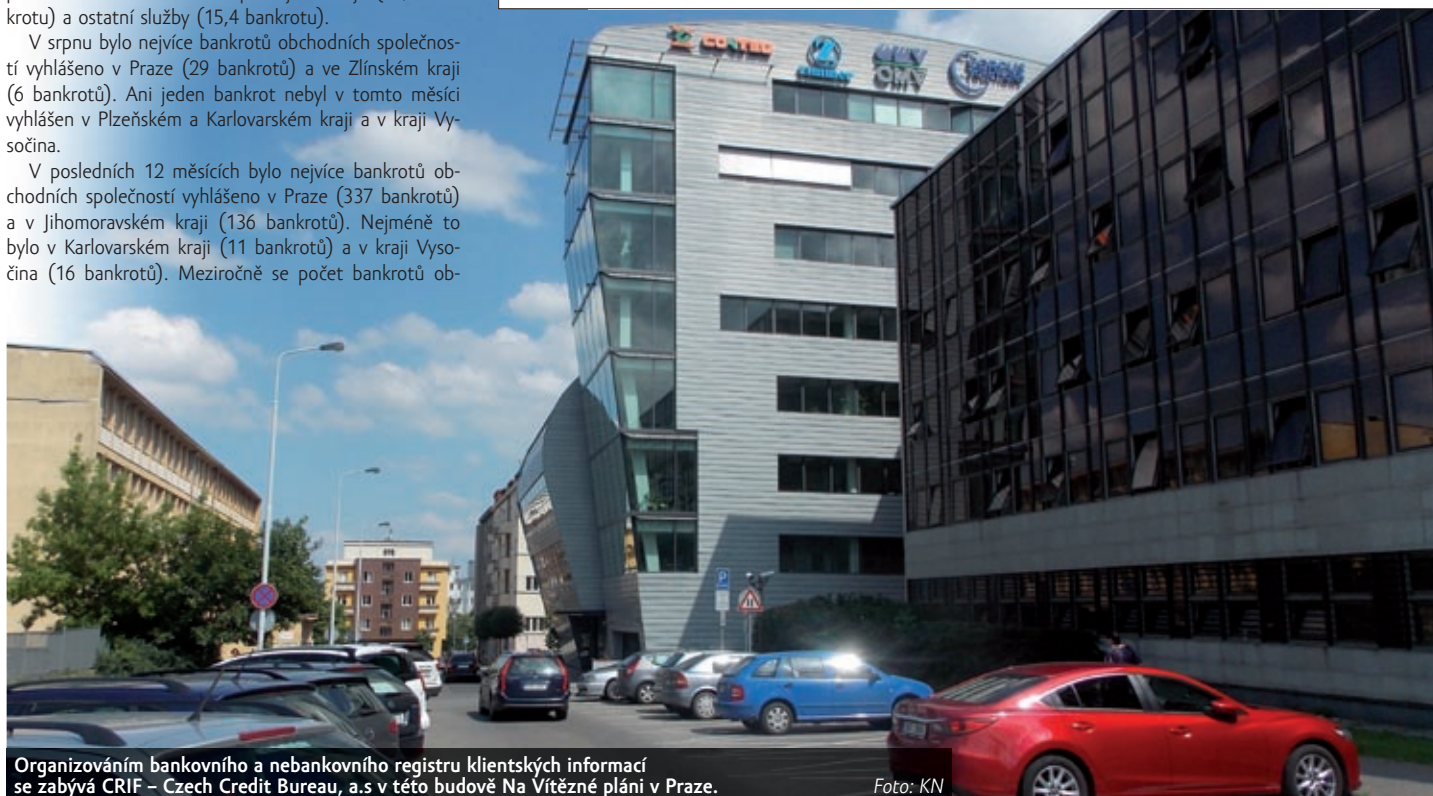
Organizováním bankovního a nebankovního registru klientů se zabývá CRIF – Czech Credit Bureau, a.s v této budově Na Vítězné pláni v Praze.