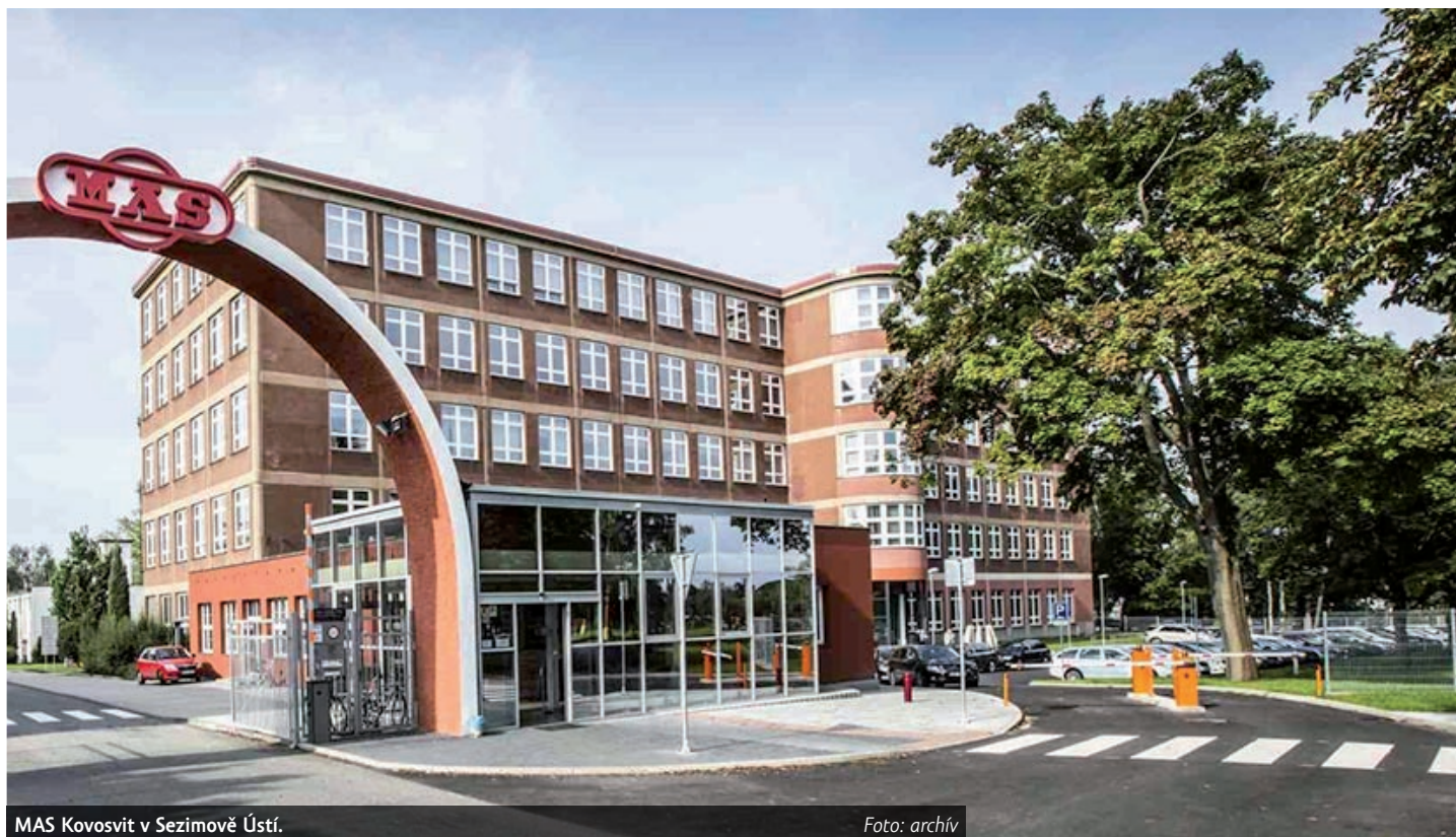
MAS Kovosvit v Sezimově Ústí.