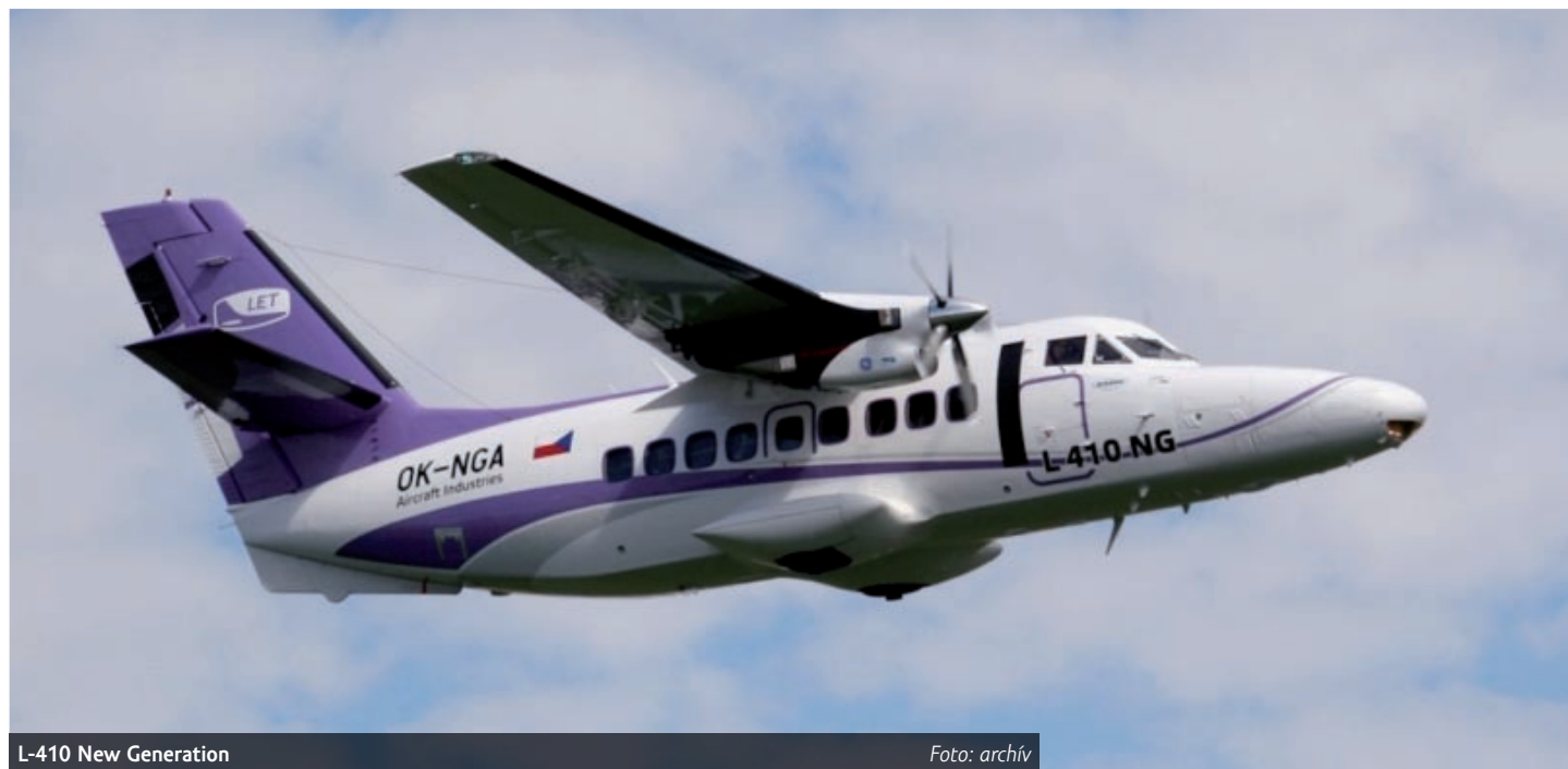
L-410 New Generation