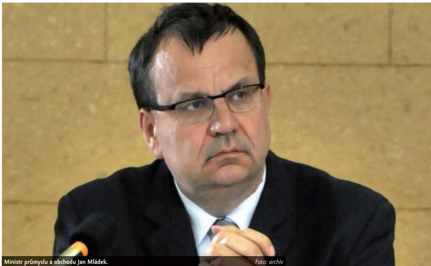
Ministr průmyslu a obchodu Jan Mládek.

Postup navržený Mládkem ale nepodpořili ministři KDU-ČSL, řekl Jurečka. „Už jsme ministři předem avizovali, že chceme opravdu podrobné informace o finanč-