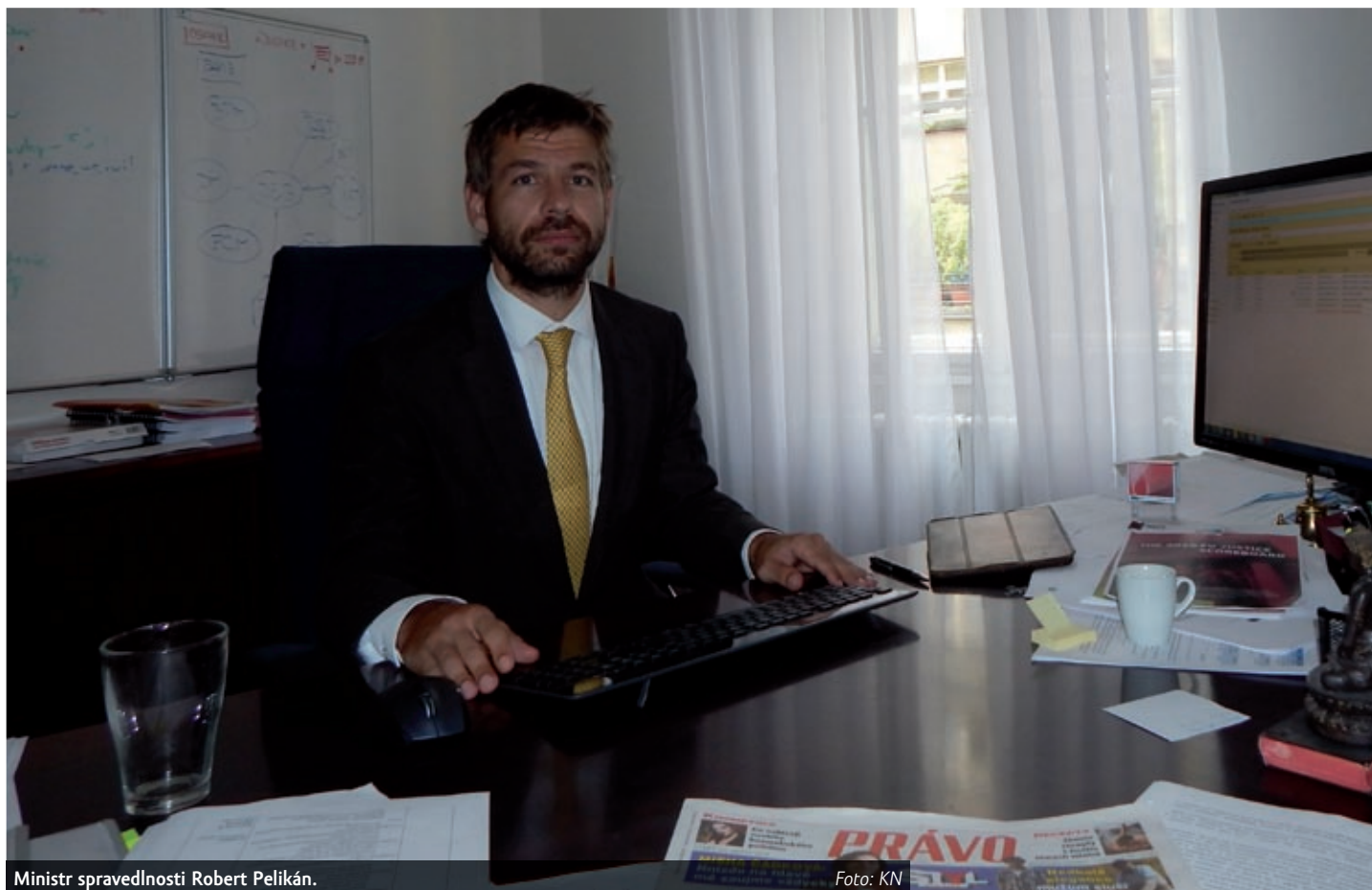
Ministr spravedlnosti Robert Pelikán.

Justici se v posledních dvou letech daří modernizovat – soudy a věznice nově využívají na 150 videokonferenční zařízení a šetří tak Vězeňské službě náklady na eskorty. Ministerstvo spravedlnosti také vyvinulo nový model jmenování soudců, který pomáhá hlavně nejvytíženějším soudům. Model, kterým již bylo jmenováno