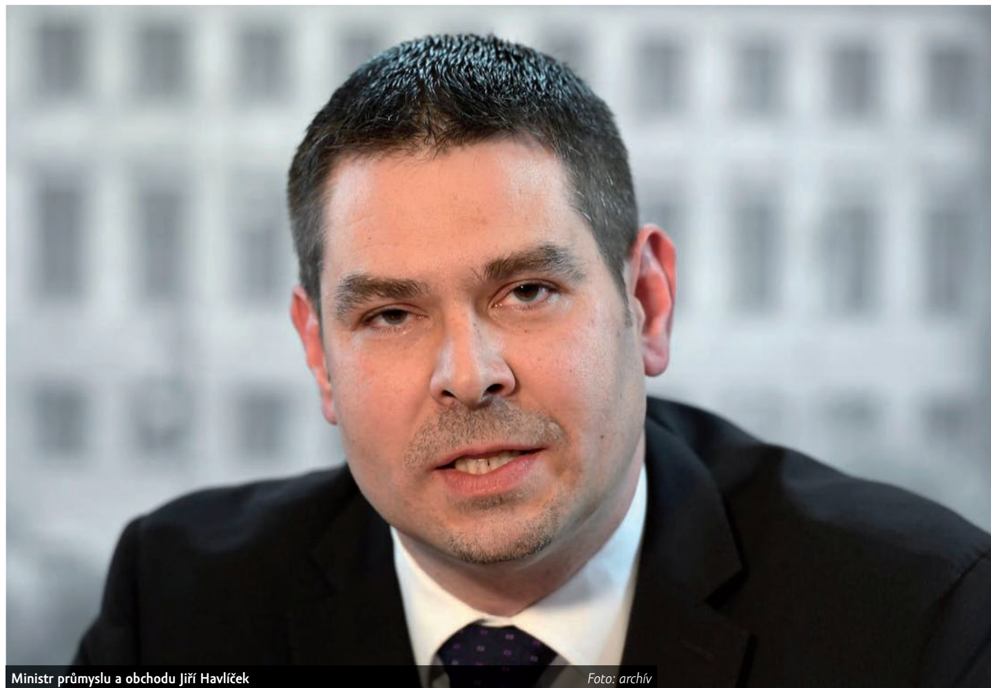
Ministr průmyslu a obchodu Jiří Havlíček