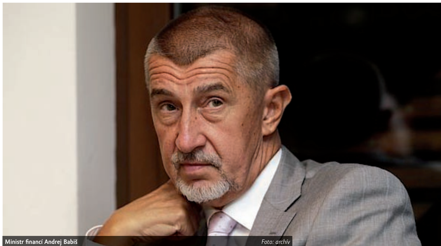
Ministr financí Andrej Babiš

Naopak Diamo – o jehož nabídce se dřív mluvilo a jednalo o ní vláda – vedení OKD neoslovilo. „Diamo takovou výzvu od OKD nedostalo. Na základě vládního usnesení svou nabídku na odkoupení OKD do vý-