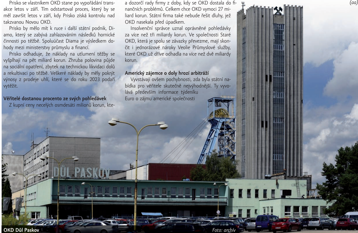
OKD Důl Paskov