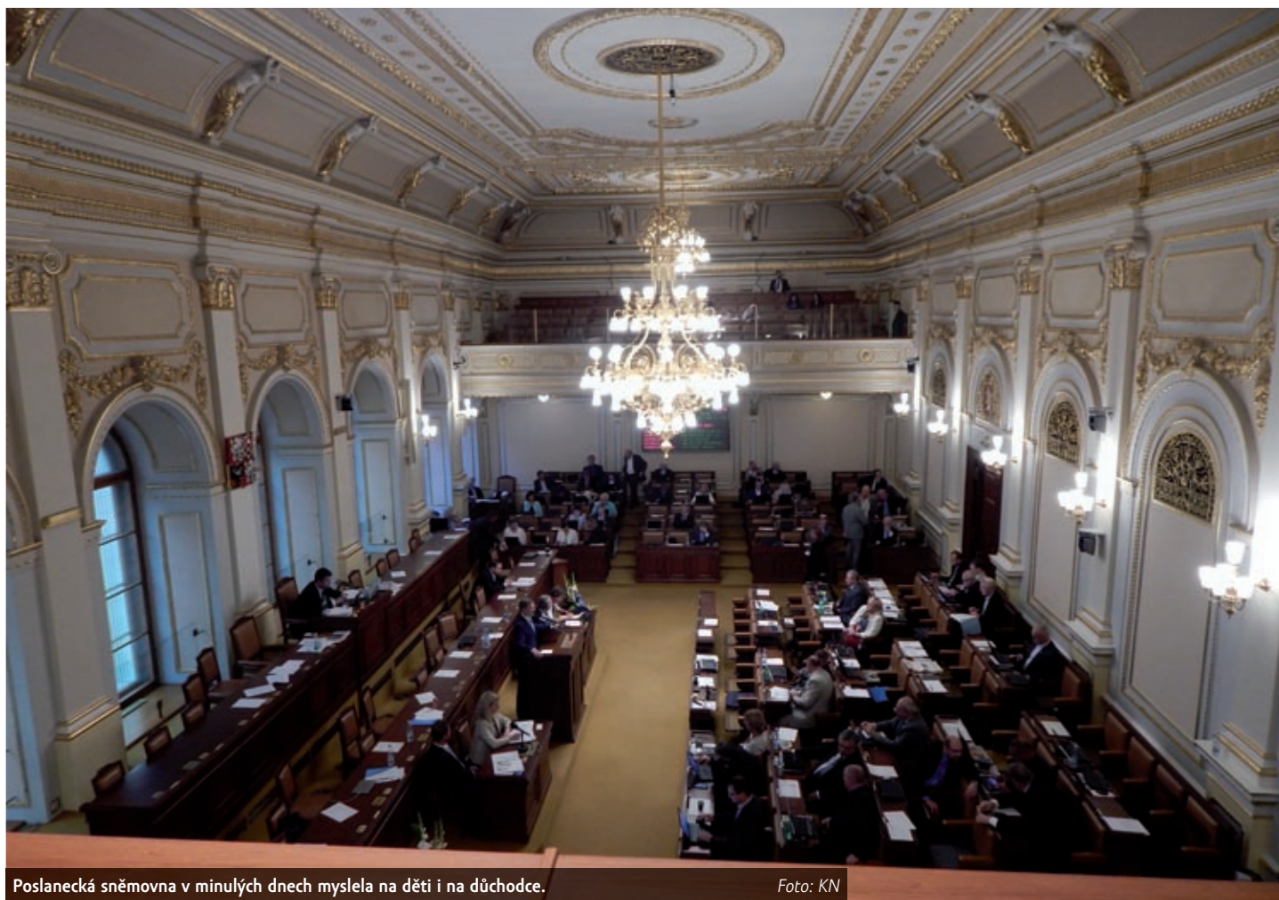
Poslanecká sněmovna v minulých dnech myslela na děti i na důchodce.