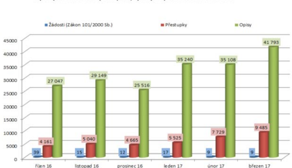
Srovnání vývoje zapsaných rozhodnutí o přestupcích, vydaných opisů a žádostí o informace

Data z registru dále odhalila, že se přestupků nejčastěji dopouští osoby ve věkové kategorii 20 – 30 let (10 204 osob), kterou následuje kategorie 30 – 40 let (8 778 osob). Nejčastější sankcí za spáchané prohřešky je pak uložení pokuty do výše 500 korun.