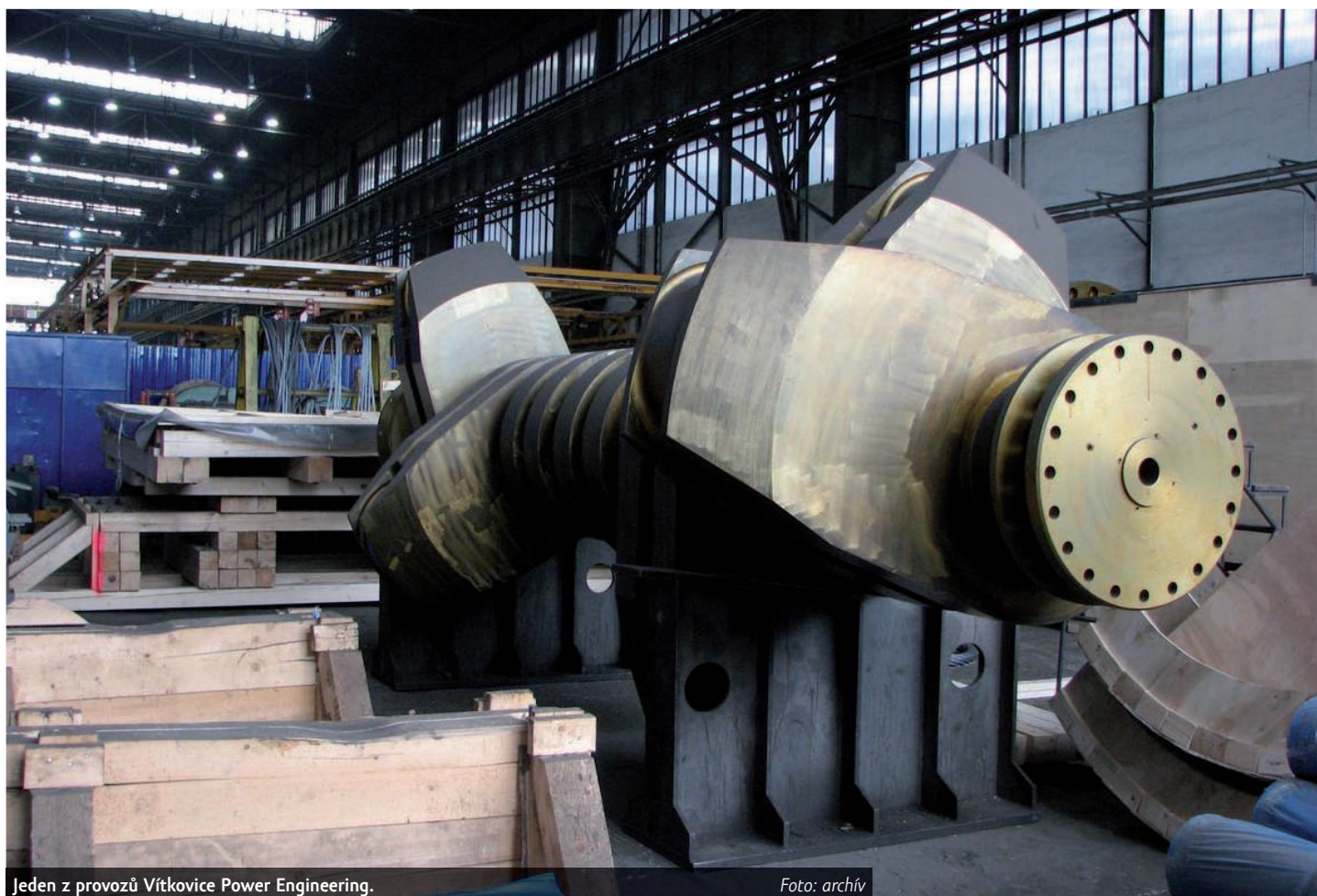
Jeden z provozů Vítkovice Power Engineering.