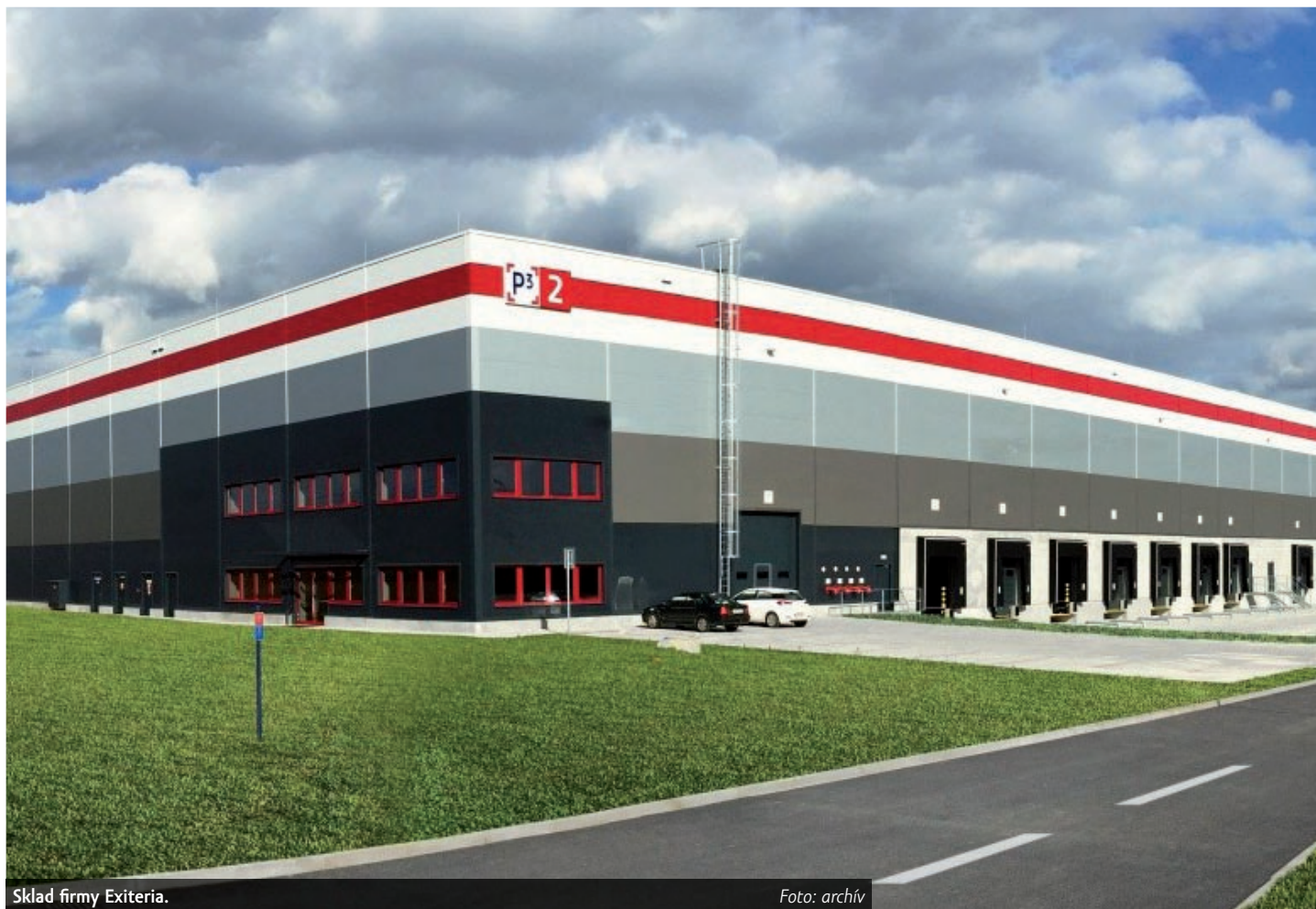
Sklad firmy Exiteria.

Exiteria má několik závazků, které jsou déle než 30 dnů po splatnosti, a není schopná na ně peníze poslat. Vůči finančnímu úřadu má firma neuhrazené závazky přesahující dvacet milionů korun, další miliony pak dluží za zdravotní pojištění.