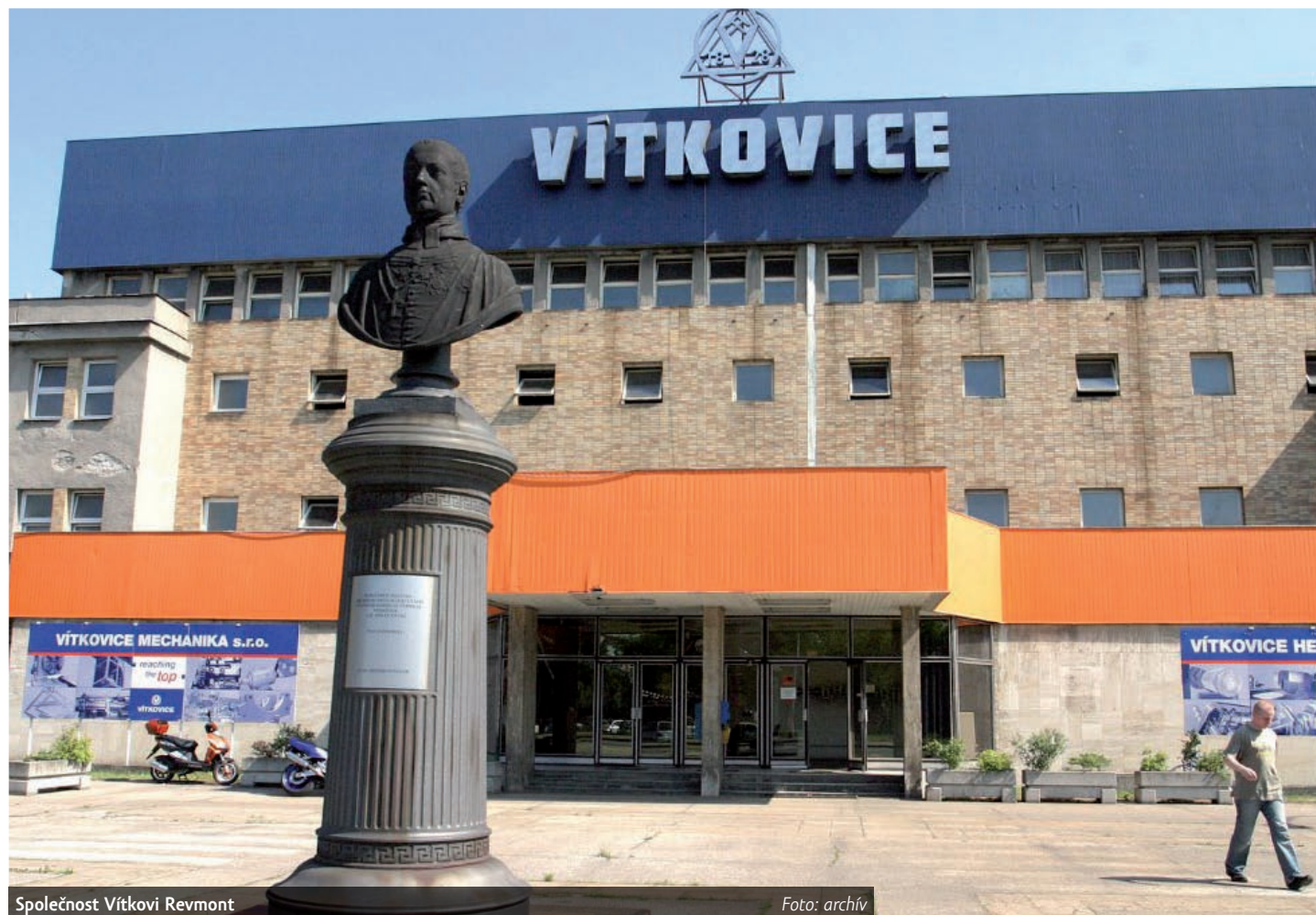
Společnost Vítkovi Revmont

Firma v insolvenčním návrhu již dříve uvedla, že má 30 věřitelů, kteří u ní mají pohledávky za více než 19 milionů korun. V loňském roce obrat Revmontu přesáhl