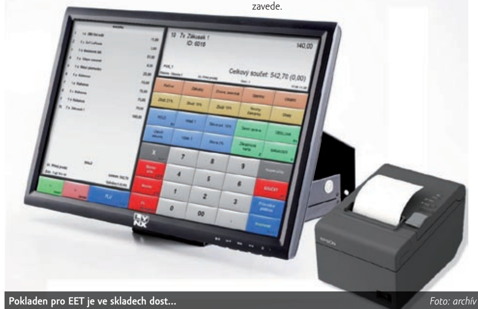
Pokladen pro EET je ve skladech dost...