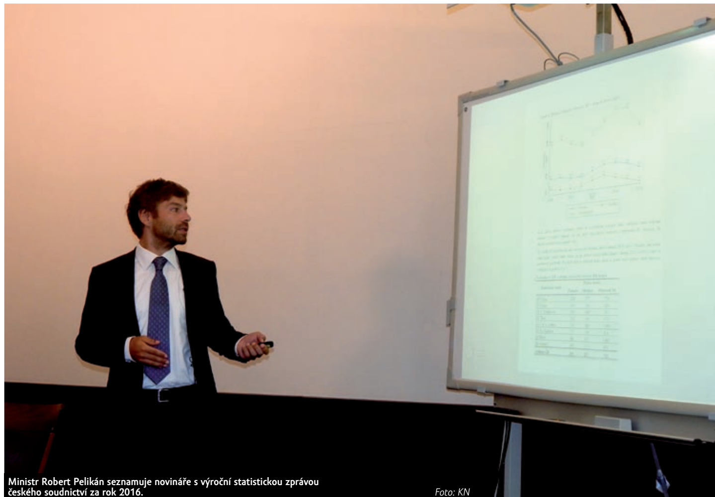
Ministr Robert Pelikán seznamuje novináře s výroční statistickou zprávou českého soudnictví za rok 2016.

Dalším často zmiňovaným pojmem je přetíženost sou-