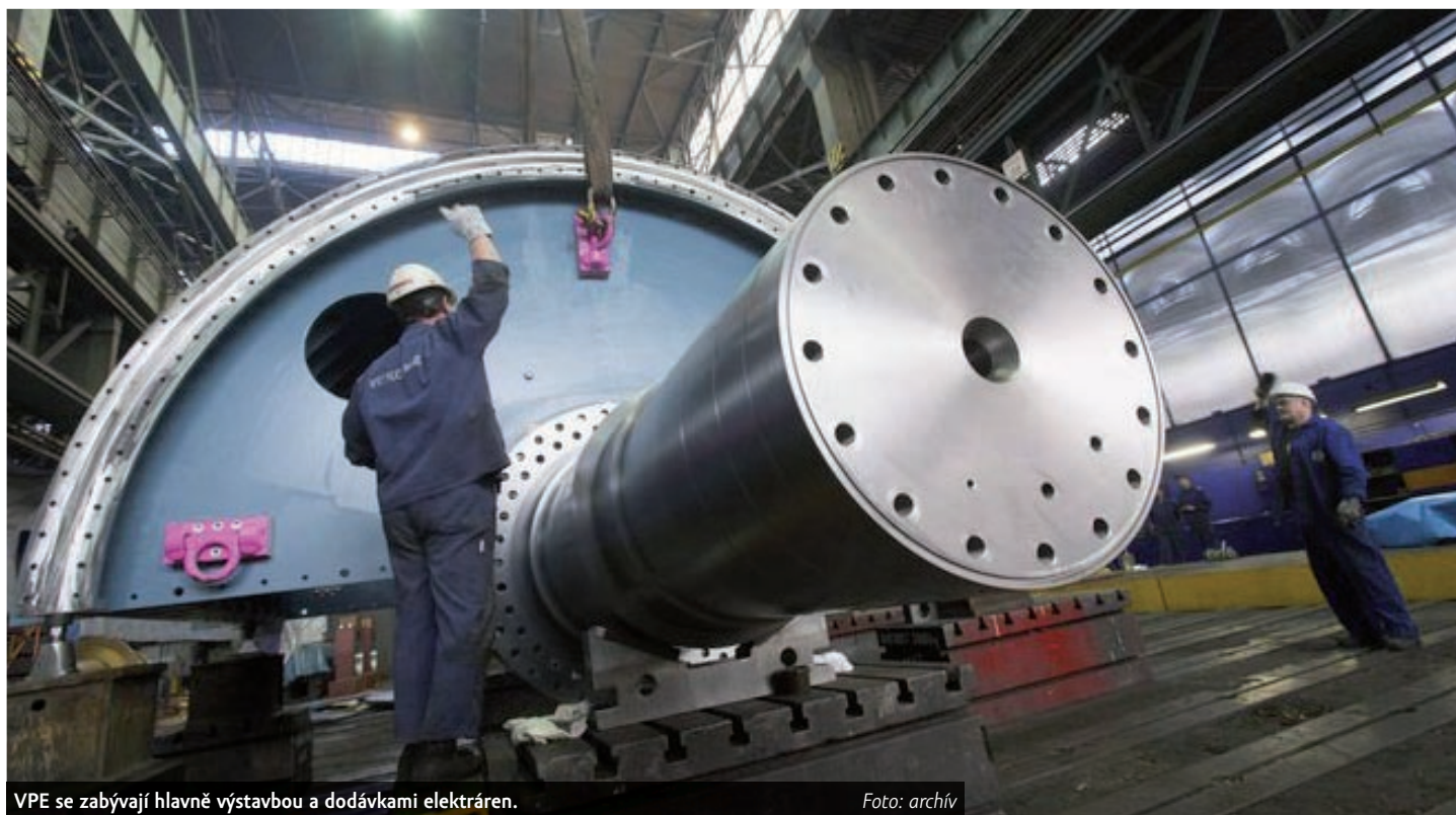
VPE se zabývá hlavně výstavbou a dodávkami elektráren.

Pozoruhodné je, že mateřská společnost Vítkovice, a. s., se od návrhu představenstva VPE distancovala. Uvedla, že investorem pro VPE nikdy být neměla a že podporu firmě naopak zopakovala. Konkurz podle mluvčí skupiny Evy Kijonkové ohrožuje vstup investorů a také zvyšuje riziko, že věřitelům klesnou výnosy. Kijonková navíc informovala o tom, že by krokem vedení VPE, který dle jejich slov nebyl s nikým konzultován, mohla být ohrožena jednání s možným investorem do tureckého projektu Adularya, který táhne VPE i celou skupinu Vítkovice ke dnu.