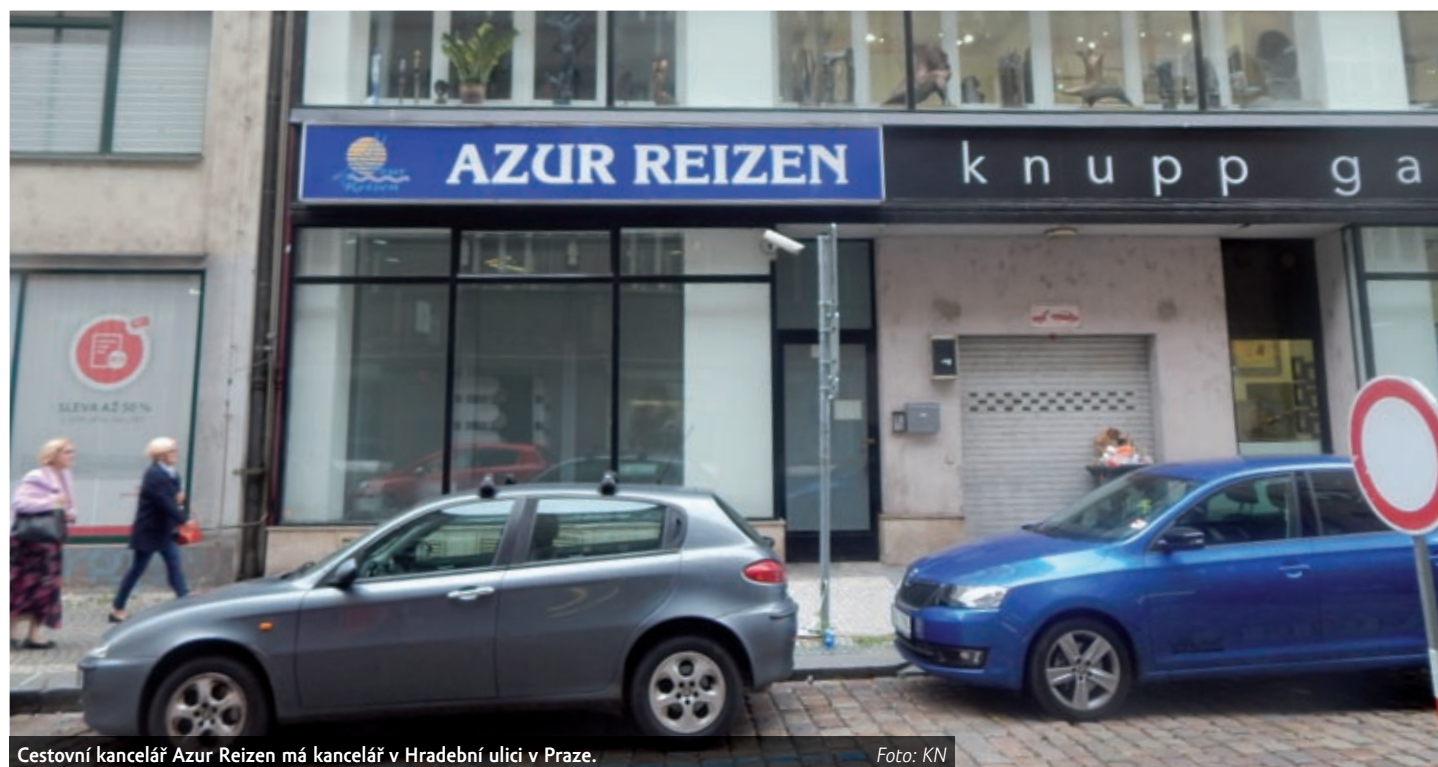
Cestovní kancelář Azur Reizen má kancelář v Hradecné ulici v Praze.

Podle serveru zpravy.aktualne.cz zkrachovalé cestovní kanceláře Azur Reizen a Maxi Reisen měly v zahraničí 450 turistů, dalších 550 lidí na svou dovolenou již neodletí. ČTK to sdělila Česká podnikatelská pojišťovna (ČPP), u které byly obě společnosti pojištěné proti úpadku. Pojišťovna nyní zjišťuje rozsah škody.