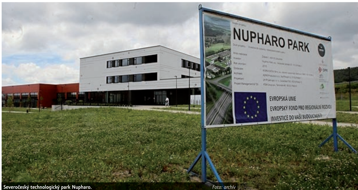
Severočeský technologický park Nupharo.