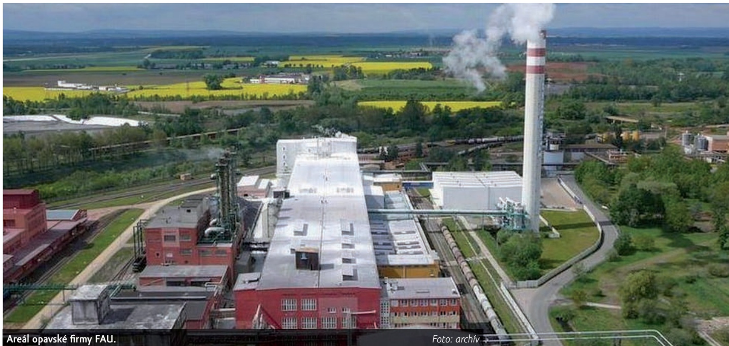
Areál opavské firmy FAU.