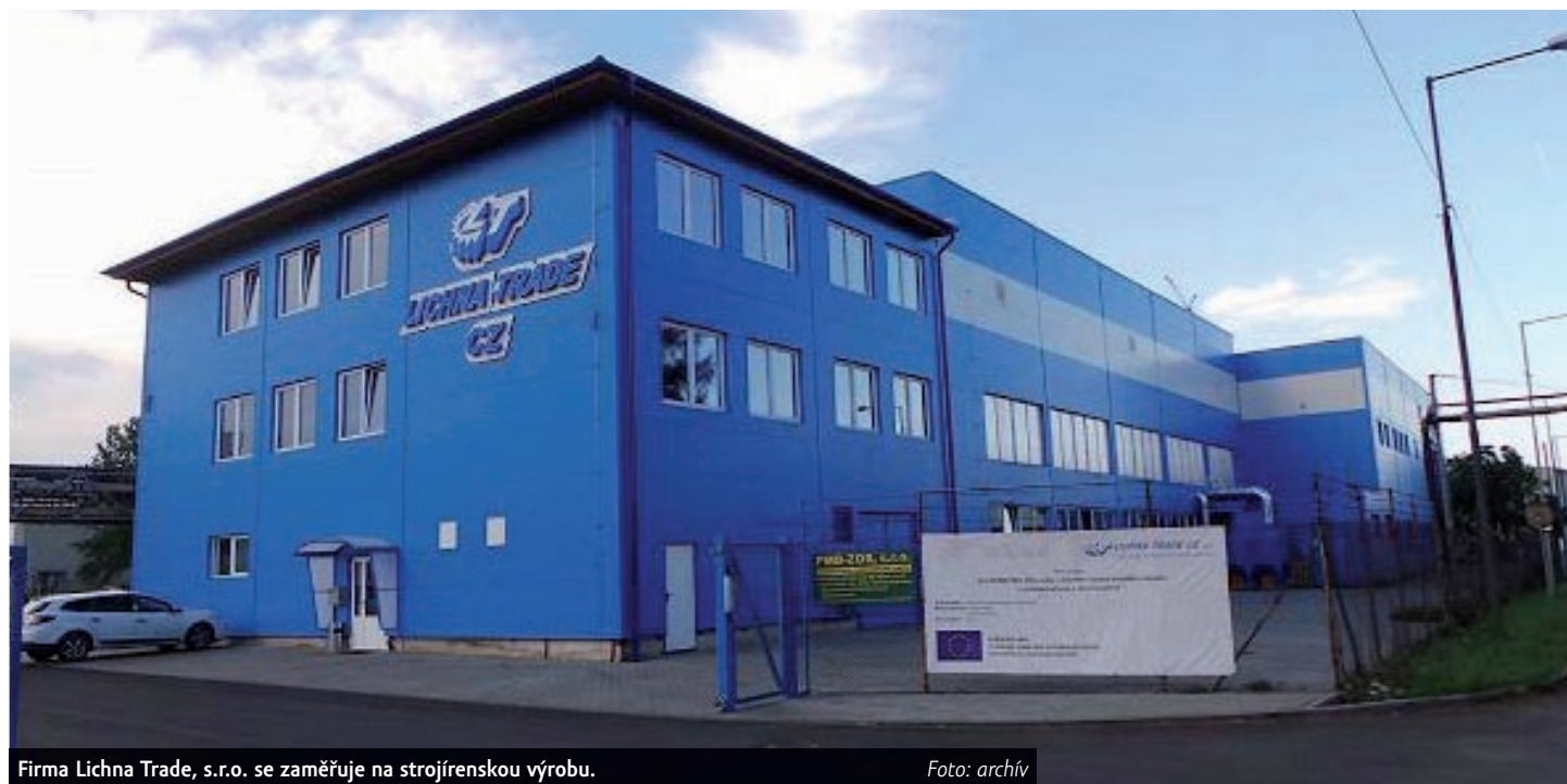
Firma Lichna Trade, s.r.o. se zaměřuje na strojírenskou výrobu.