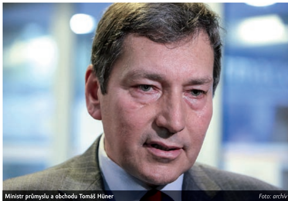
Ministr průmyslu a obchodu Tomáš Hüner