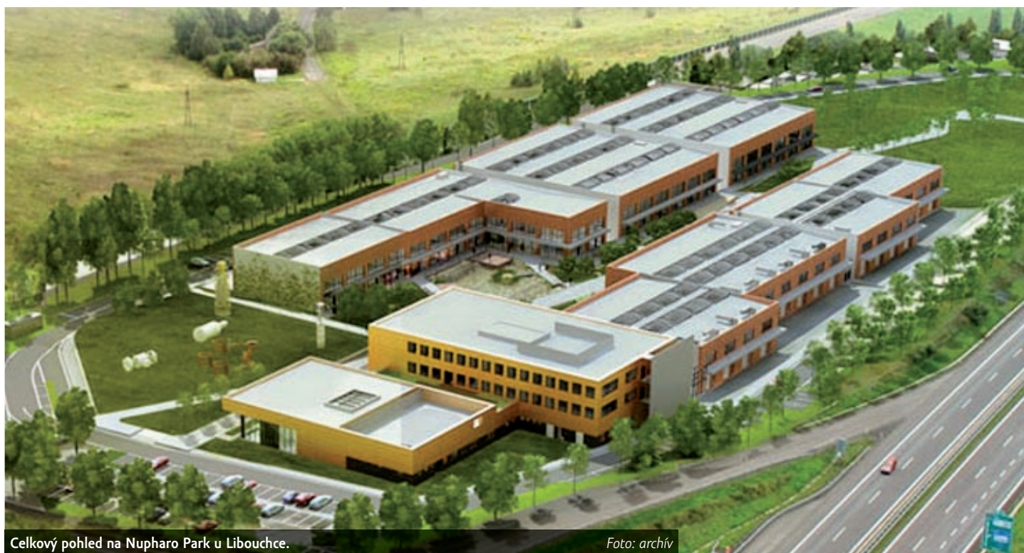
Celkový pohled na Nupharo Park u Libouchce.

O budoucnosti dotace napoví kontrola ze strany ministerstva průmyslu a obchodu, resort ji chtěl uzavřít koncem ledna. Prověrka vynaložení peněz z evropského dotačního programu Podnikání a inovace probíhá už od podzimu 2016. Podle informací LN ministerští kontrolaři na místě dlí pochybení odhalili, čerstvé rozhodnutí soudu je v jejich zjištěních utvrdilo. „Poskytovatel dotace vyhodnotil tuto skutečnost jako podezření