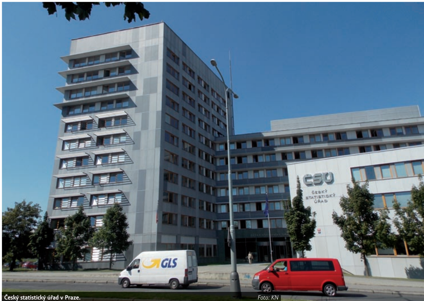
Český statistický úřad v Praze.