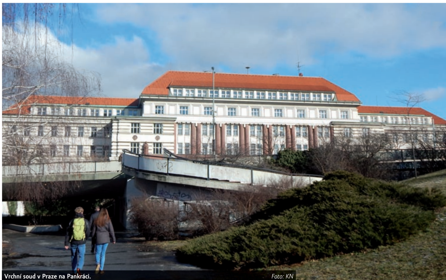
Vrchní soud v Praze na Pankráci.