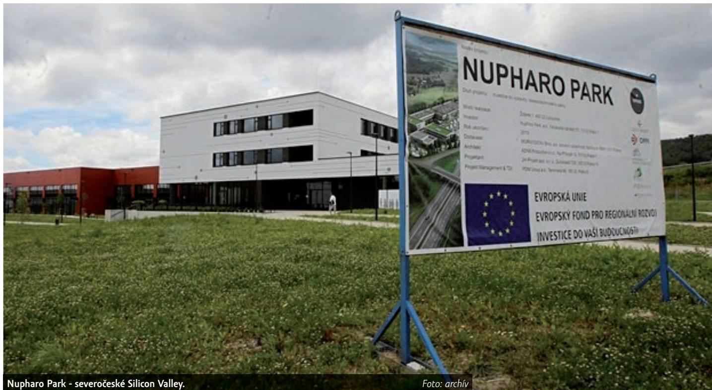
Nupharo Park - severočeské Silicon Valley.