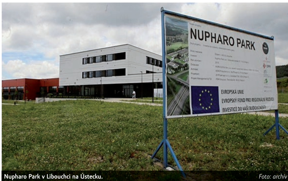
Nupharo Park v Libouchci na Ústecku.

Výše celkové částky tak ještě není definitivní.