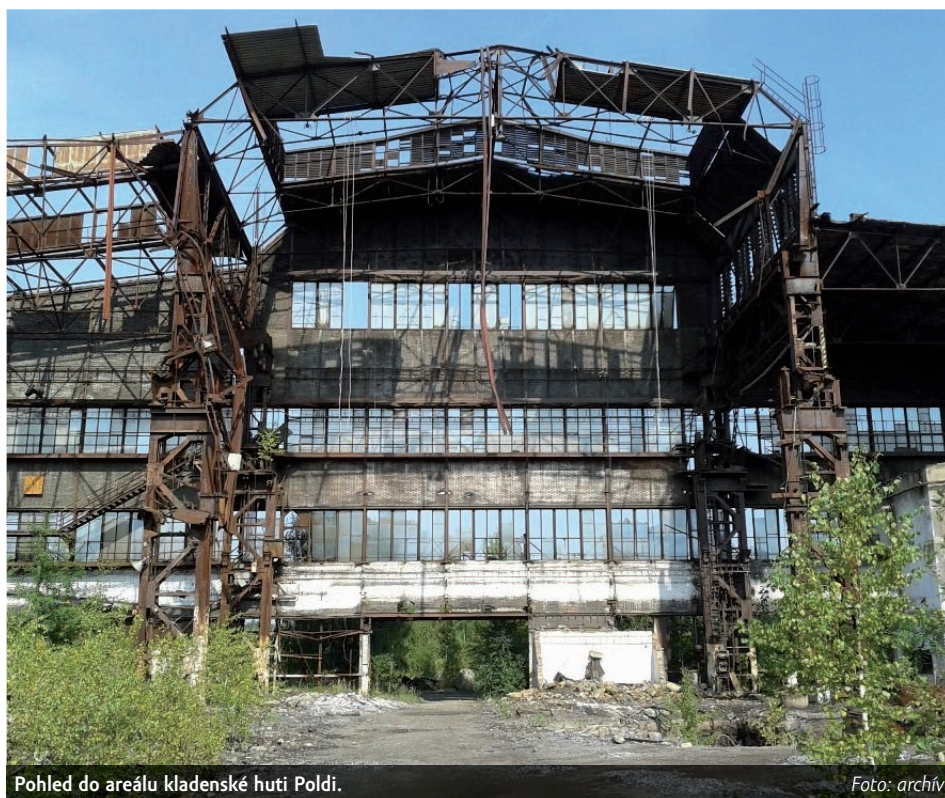
Pohled do areálu kladenské huti Poldi.

První dražba, která se konala v dubnu, byla zmařena. Vydražitel, společnost Compagnia del mediterraneo Steel, měl zaplatit 261 milionů korun. Ve stanoveném