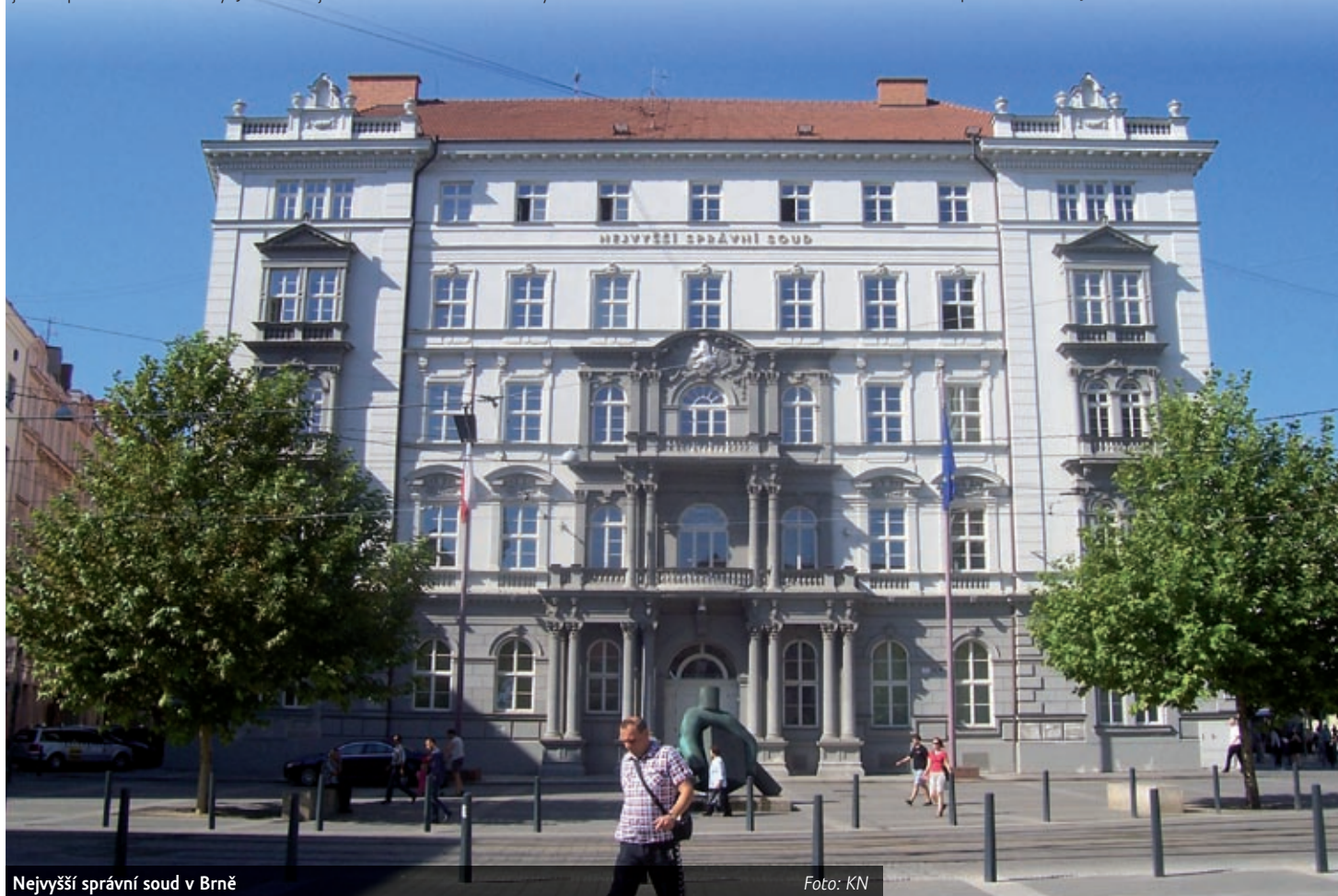
Nejvyšší správní soud v Brně

Představy o tom, kolik by to mělo být, se podle Kněžíňka rozcuchávají, protože není jasné, o kolik se zvednou platy ve veřejné sféře obecně. Platy by podle ministra mohly stoupnout o dvanáct až patnáct procent. Řekl to v Brně na odpoledním brífinku po setkání s předsedou Nejvyššího soudu Pavlem Šámalem a předsedou Nejvyššího správního soudu Josefem Baxou.