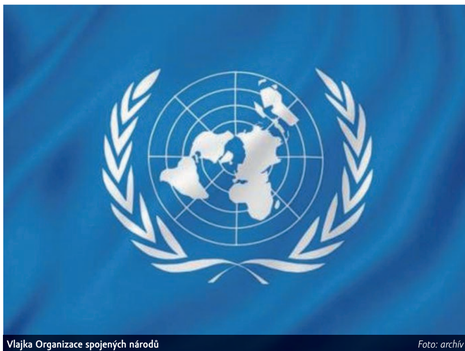
Vlajka Organizace spojených národů