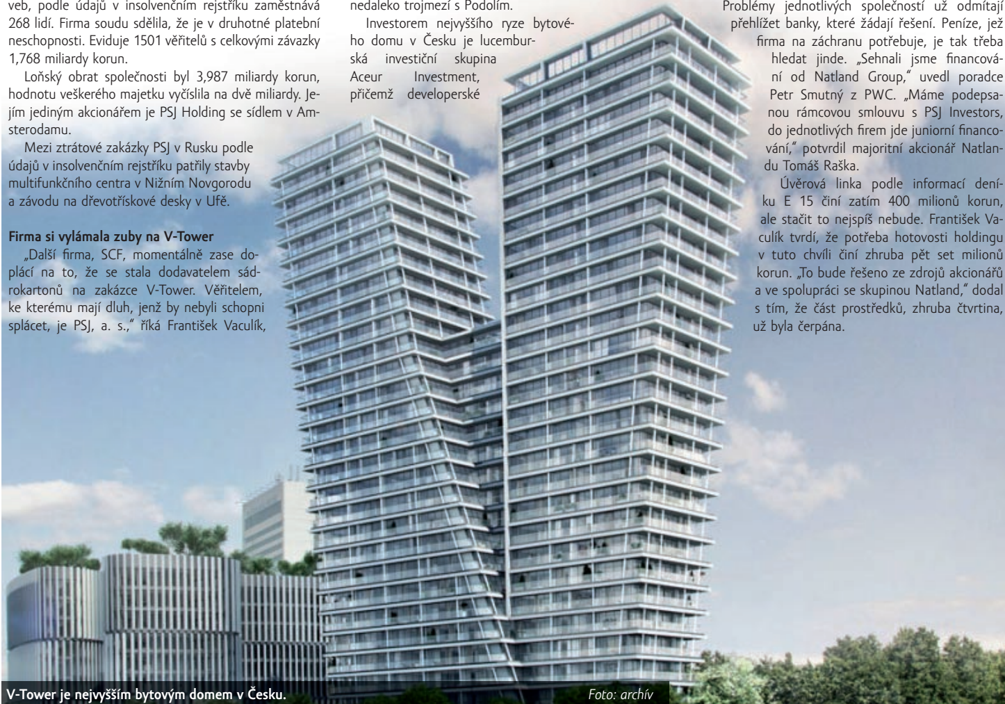
V-Tower je nejvyšším bytovým domem v Česku.

Úvěrová linka podle informací deníku E 15 činí zatím 400 milionů korun, ale stačit to nejspíš nebude. František Vaculík tvrdí, že potřeba hotovosti holdingu v tuto chvíli činí zhruba pět set milionů korun. „To bude řešeno ze zdrojů akcionářů a ve spolupráci se skupinou Natland,“ dodal s tím, že část prostředků, zhruba čtvrtina, už byla čerpána.