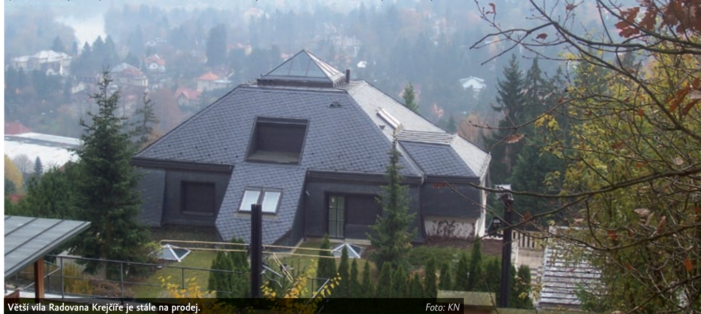
Větší vila Radovana Krejčíře je stále na prodej.

Exekutoři by se však měli znovu pokusit prodat větší vilu Radovana Krejčíře. Odhadní cena je podle znaleckého posudku něco málo přes devadesát sedm milionů korun. Už dříve se ji pokoušeli prodat za dvě třetiny této ceny, tedy pětadesát milionů. Když za tuto cenu slavnou nemovitost nikdo nechtěl, klesla vyvolávací cena