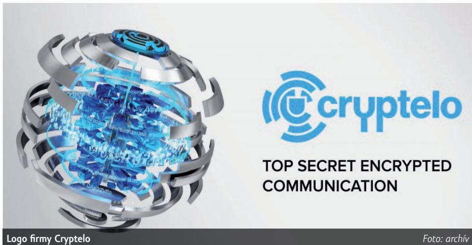
Logo firmy Cryptelo