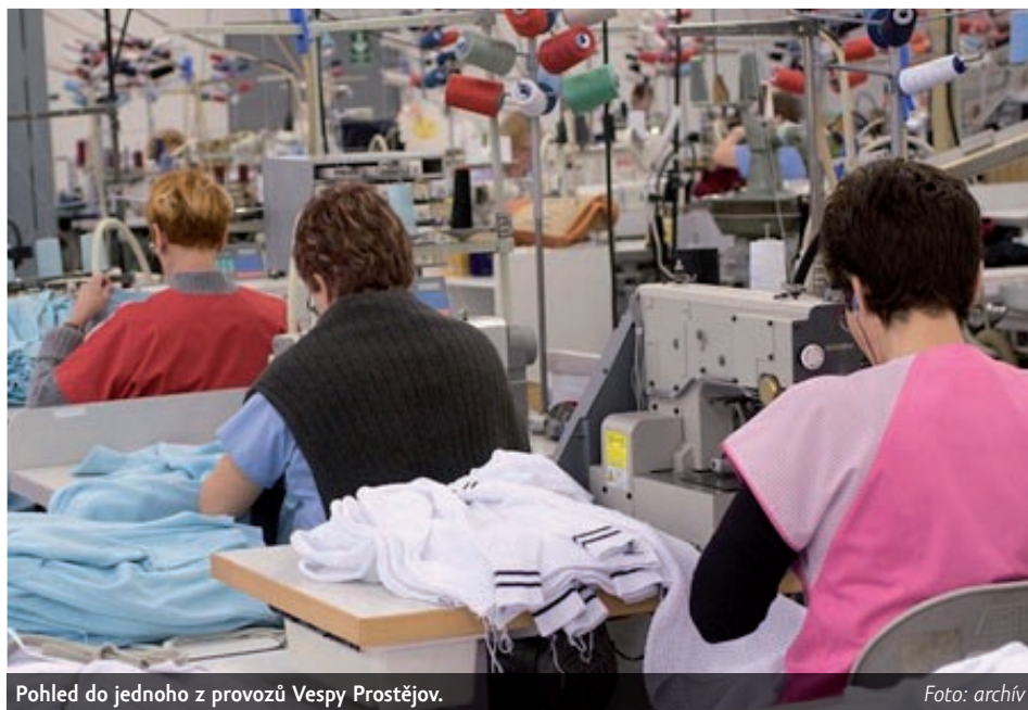
Pohled do jednoho z provozů Vespy Prostějov.

Vespa Prostějov ročně utržila zhruba 100 milionů korun a zaměstnávala 130 pracovníků. Většinu pánských obleků exportovala do zemí EU. Hlavním odběratelem její produkce byla Itálie. Do finančních problémů se exportně orientovaná Vespa Prostějov podle Vařeky dostala v posledních třech letech, a to kvůli masivnímu růstu mzdových nároků zaměstnanců a současnému posilování koruny vůči euru.