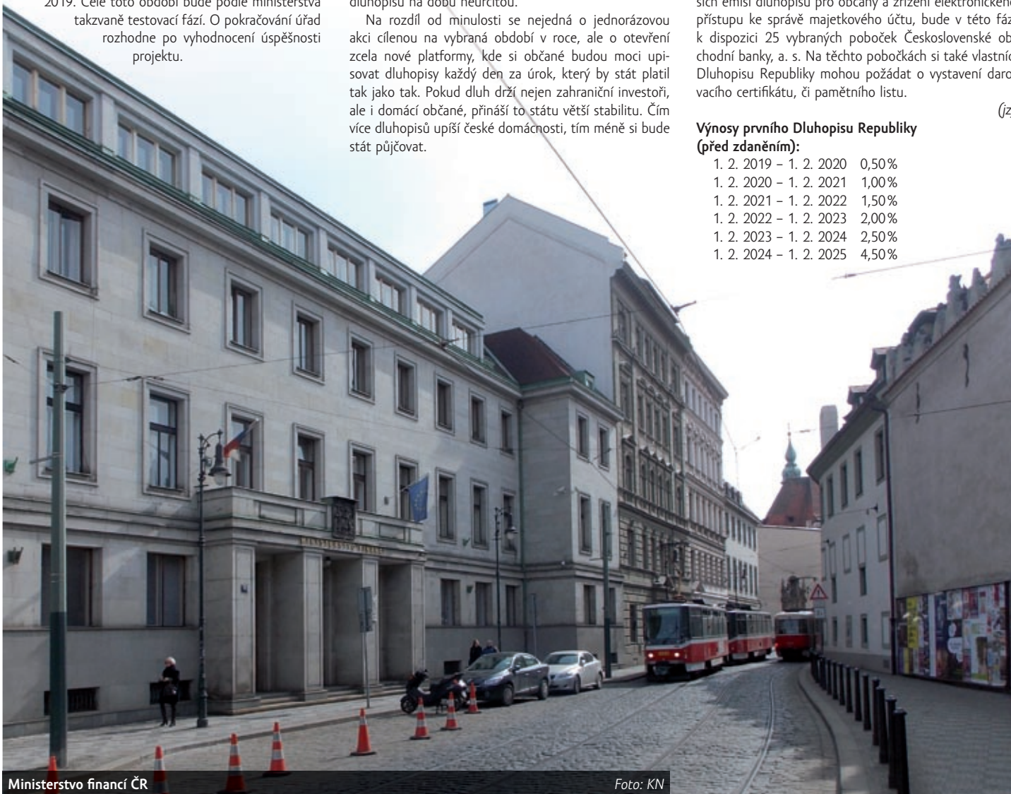
Ministerstvo financí ČR