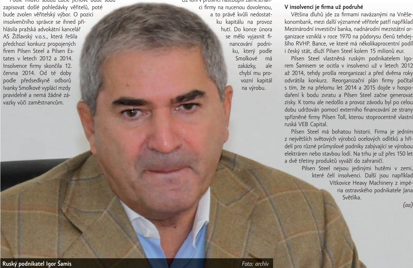
Ruský podnikatel Igor Šamis