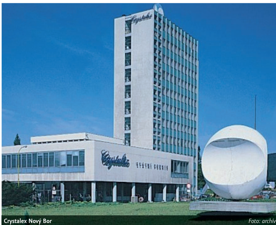
Crystalex Nový Bor

Všechny sklárny skupiny BCT dnes podnikají s novými vlastníky a znovu zaměstnávají tisíce lidí.