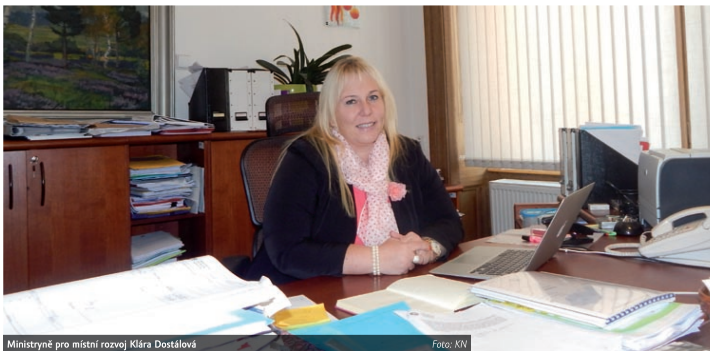
Ministryně pro místní rozvoj Klára Dostálová