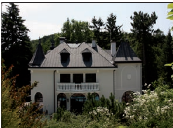
Místo konání dražby: www.prokonzulta.cz, dne 11.9.2019, prohlídka 30.8. a 6.9. ve 13 hodin. Více na www.prokonzulta.cz