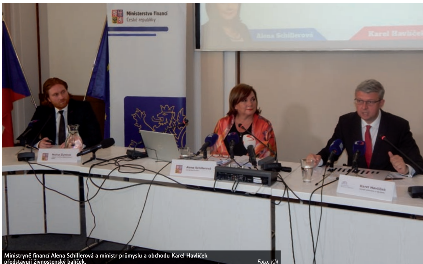
Ministryně financí Alena Schillerová a ministr průmyslu a obchodu Karel Havlíček představují živnostenský balíček.

V rámci jedné platby podnikatelé s obrátem do jednoho milionu korun ročně již nebudou muset přiznávat daň z příjmu a odvody na třech různých formulářích, nově k zaplacení poslouží jedna paušální platba. Sníží se tak podle ministerstev administrativa a nebude třeba platit za účetní služby. Opatření by mělo začít platit v roce 2021.