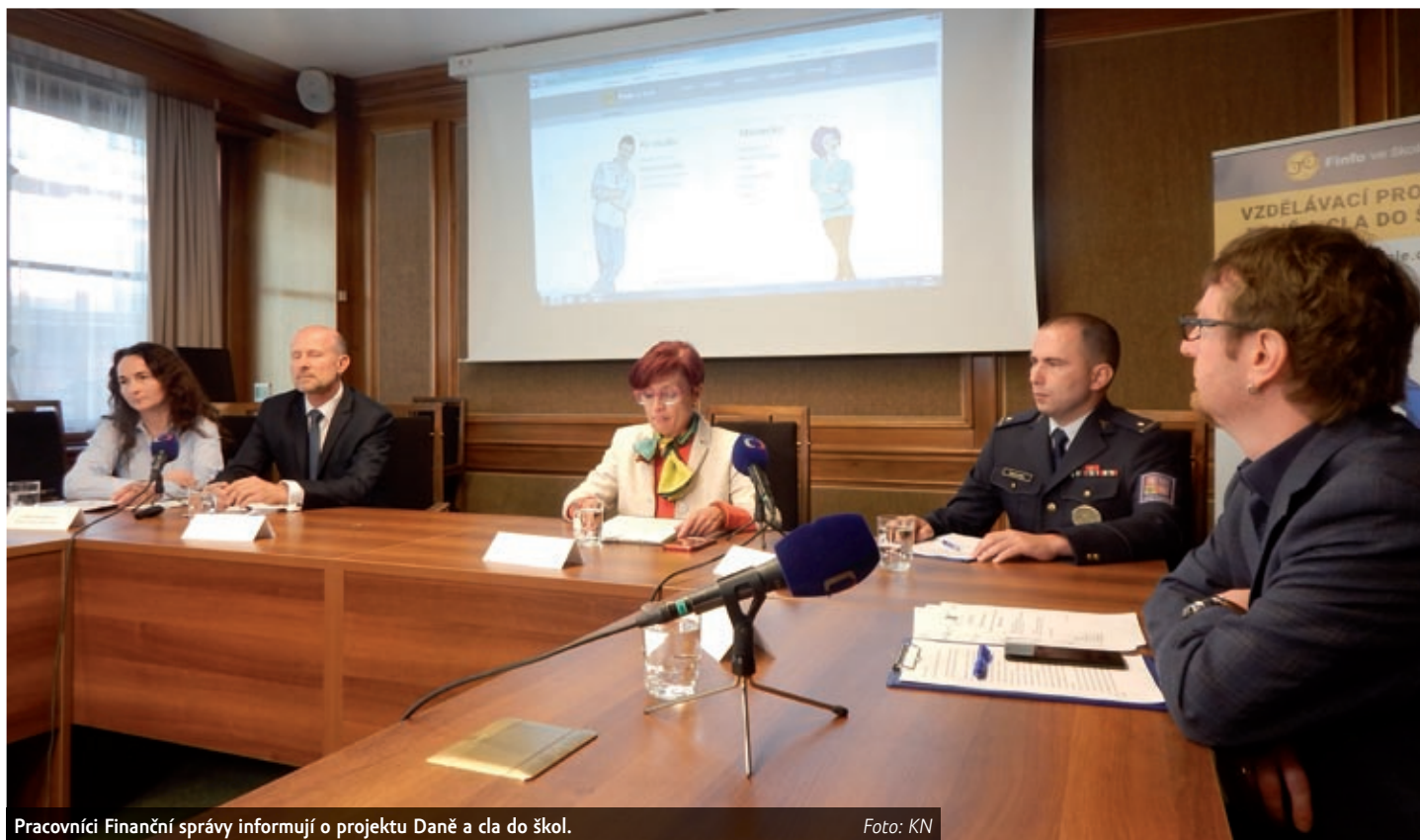
Pracovníci Finanční správy informují o projektu Daně a cla do škol.

Hlavním úkolem lektorů bude studentům ukázat, že je správné daně a také cla platit, protože jim za jejich peníze stát zajistí základní služby. Součástí nového webu