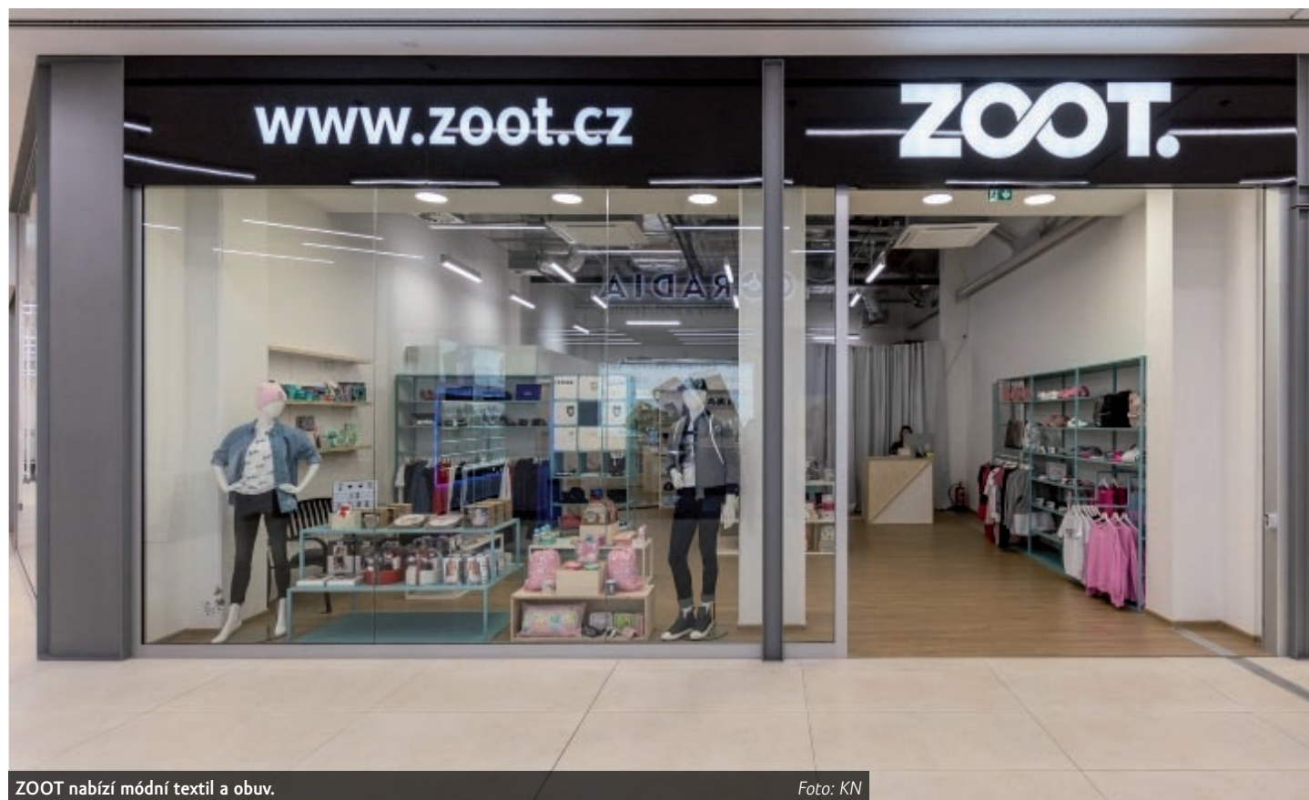
ZOOT nabízí módní textil a obuv.