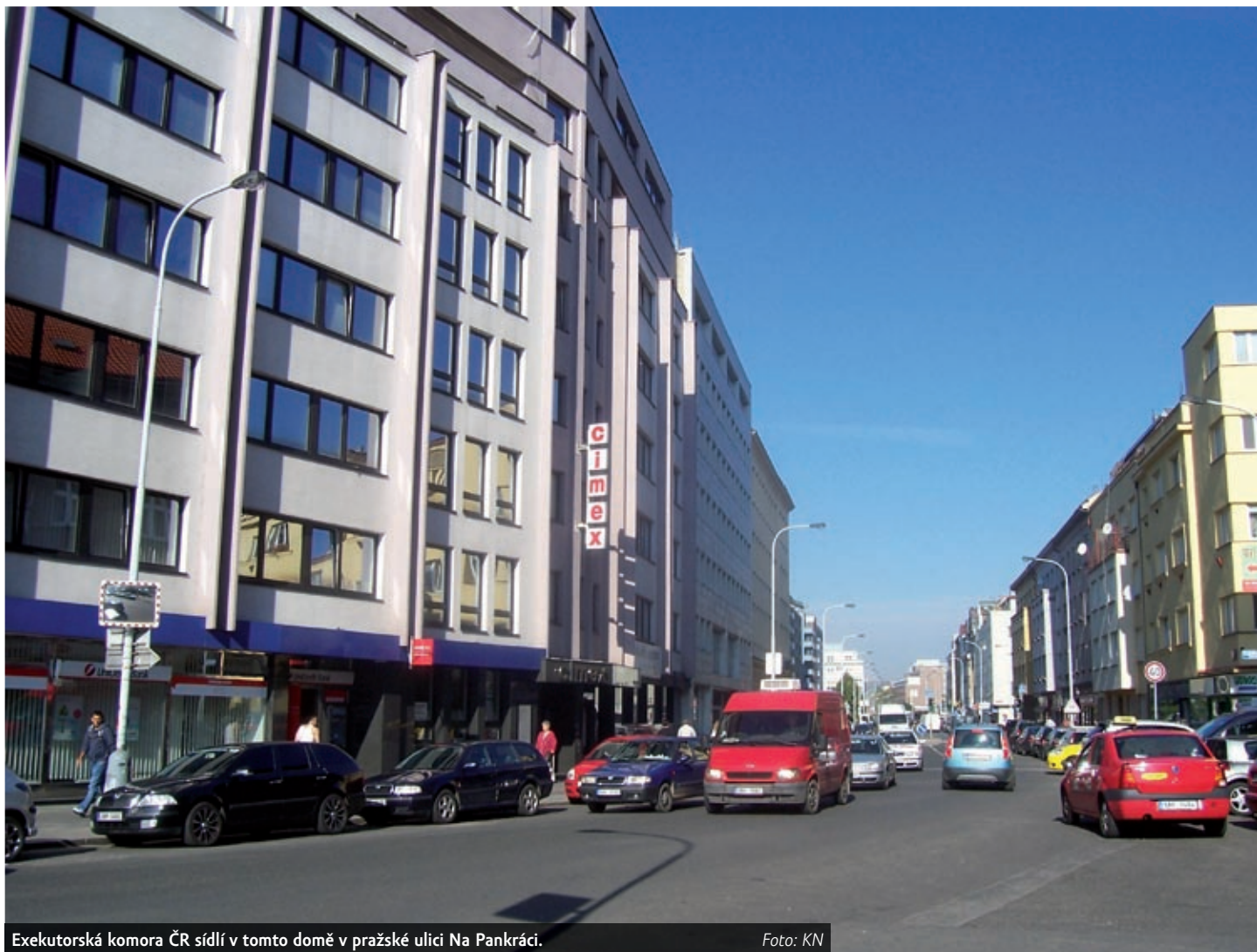
Exekutorská komora ČR sídlí v tomto domě v pražské ulici Na Pankráci.

V minulosti se útočníci vydávali i za společnosti DM Drogerie, Penny Market či Lidl. Nyní prakticky stejný trik zkouší také pod hlavičkou firem Apple či Raiffeisenbank. Zatímco ještě před pár lety číhalo nebezpečí na příjemce především v nevyžádaných e-mailech, s rozmachem chytrých telefonů se uživatelé stále častěji mohou setkat také s útočnými SMS zprávami.