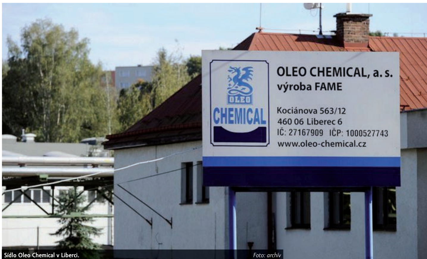
Sídlo Oleo Chemical v Liberci.

Vedle zákonnosti a poctivosti, kde se Vrchní soud postavil jednoznačně na stranu dlužníkem předloženého reorganizačního plánu, vyzval Vrchní soud ve svém usnesení Městský soud v Praze, aby se vypořádal i s dalšími třemi oblastmi nezbytnými pro schválení reorganizačního plánu, které ve svém prvotním rozhodnutí Městský