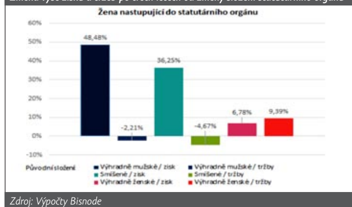
Změna výše zisku a tržeb po třech letech od změny složení statutárního orgánu

po třech letech působení nejčastěji o 48 %. Pokud bylo původní složení statutárního orgánu smíšené, zisk po třech letech nejčastěji narostl o 36 %, v případě výhradně ženského složení pak o 7 %,“ říká analytik Bisnode Milan Petrák.