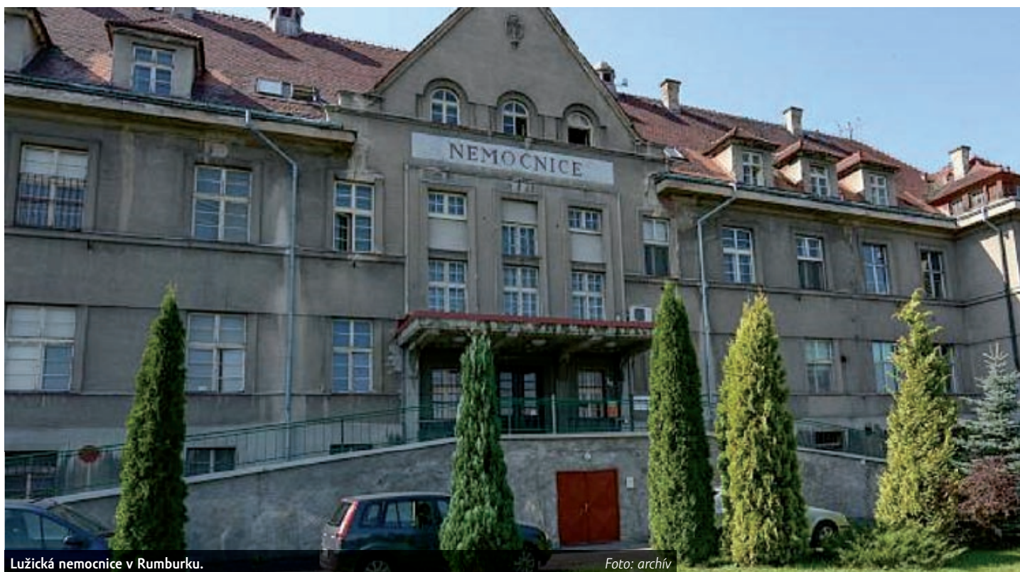
Lužická nemocnice v Rumburku.

Lužická nemocnice je jediná na Šluknovsku. Zajišťuje