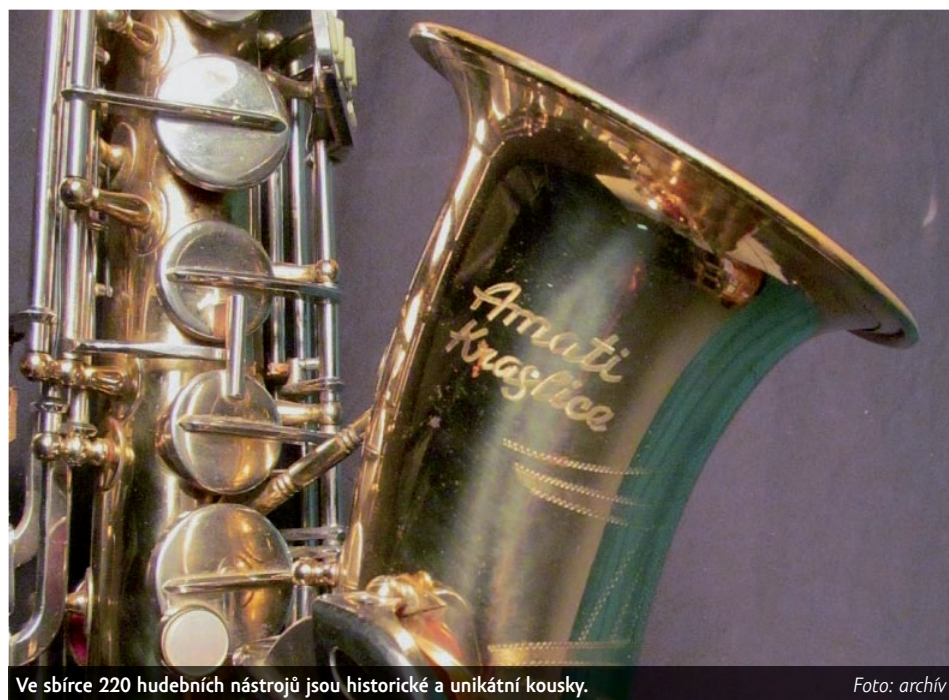
Ve sbírce 220 hudebních nástrojů jsou historické a unikátní kousky.