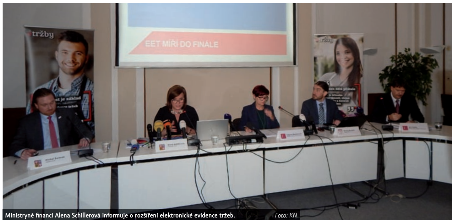
Ministryně financí Alena Schillerová informuje o rozšíření elektronické evidence tržeb.