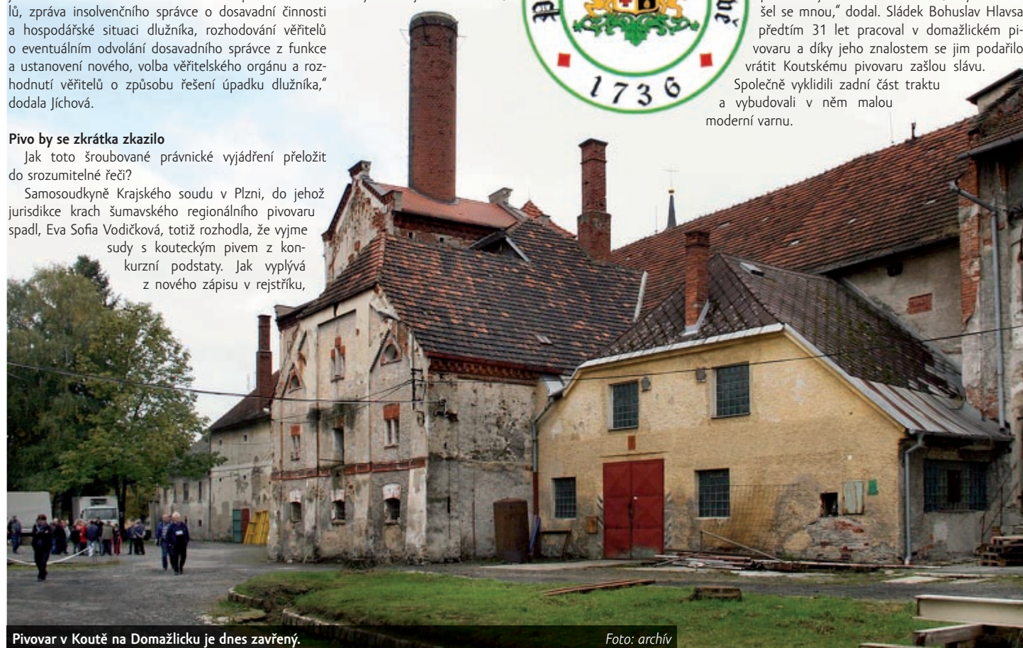
Pivovar v Koutě na Domažlicku je dnes zavřený.